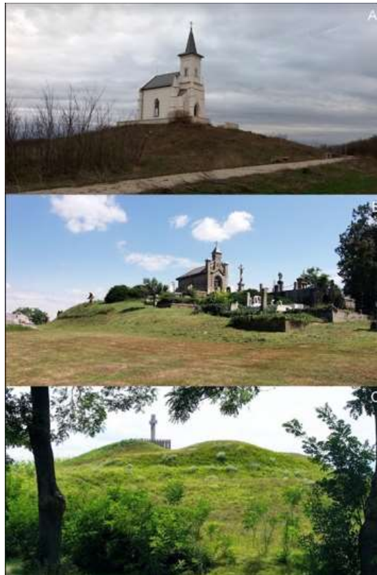
1. ábra A gyepvel borított kurgánok gyakran hordoznak kulturális értékeket. A – A Szent Móric-kápolna a Kiszfás-halmon (Magyarország, Kunhegyes); B – Temető és kriptá a Kettős-halmon (Magyarország, Fegyvernek); C – Kereszt a Ludas-halmon (Magyarország, Mindszent). Figure 1. Kurgans covered by grassland vegetation often hold cultural values as well. A – Saint Móríc chapel on the Kiszfás-halom kurgán (Kunhegyes, Hungary); B – Cemetery and crypt on the Kettős-halom kurgán (Fegyvernek, Hungary); C – A cross on the Ludas-halom kurgán (Mindszent; Hungary).