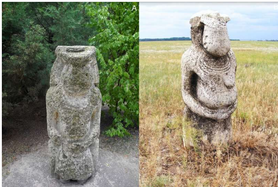
2. ábra A 9–13. század során a kunok számos esetben helyeztek el szobrokat, úgynevezett „kunbabákat” a halmokon (Ukrajna, Askania Nova Nemzeti Park). Figure 2. Cumanian anthropomorphic stone statue (so-called „stone baba”) from the 9-13 century. Stone babas were often placed on steppic kurgans (Askania Nova National Park, Ukraine).