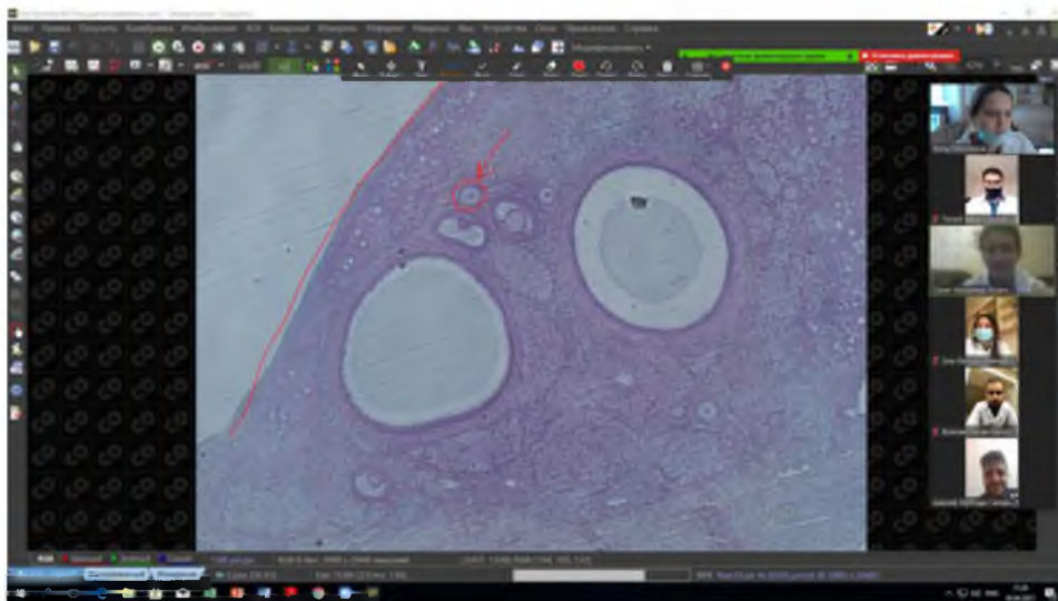
Рис. 2. Контроль практических знаний студентов через ZOOM комнату в ЭУМКД «Histology, cytology, embryology» на учебной платформе ПЕГАС Белгородского государственного национального исследовательского университета

Учебно-методический блок включает в себя: теоретические материалы, глоссарий, практикум (рабочая тетрадь), практические задания, тестовые задания.