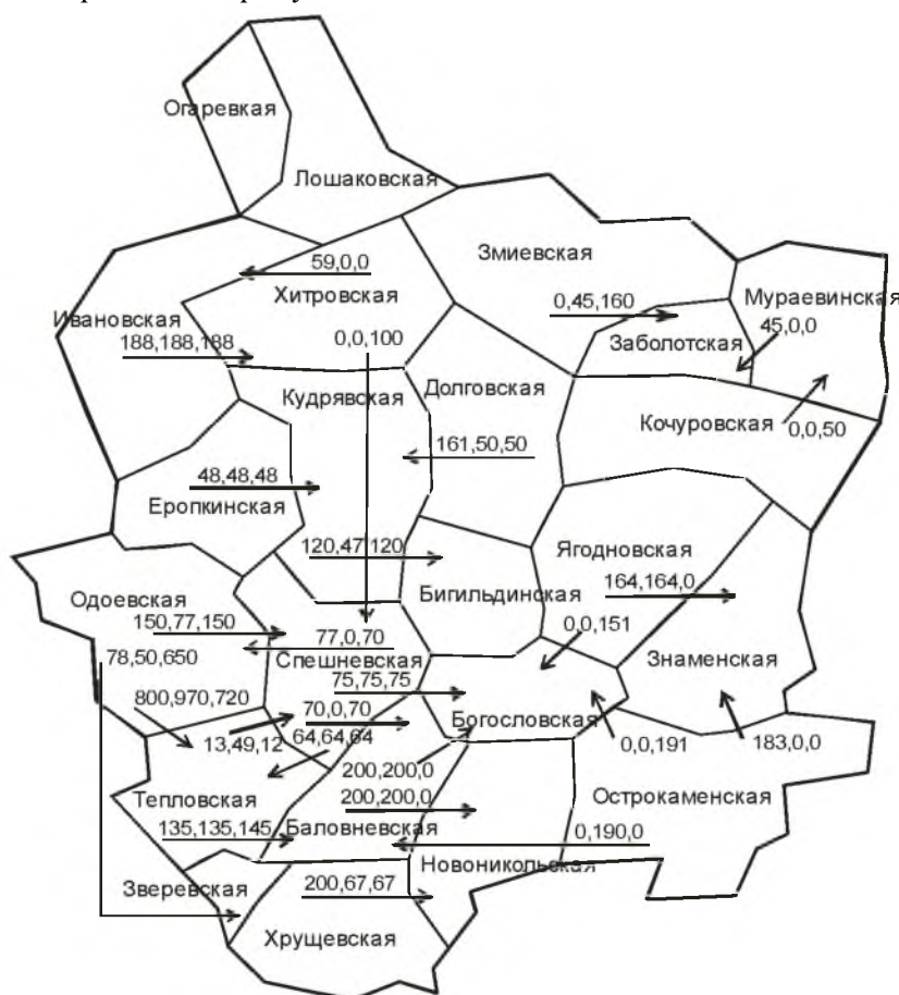
Рис. 2. Земельные площади, выделенные в волостях-донорах для волостей-реципиентов под посевы 1918–1919 гг. (в дес.) 108

Представленные материалы не отражают всей полноты и противоречивости земельного передела 1918–1919 гг. Желание воплотить в проводимом переделе принцип социальной справедливости, выразившийся в уравнительном распределении, привел к тому, что наделение протекало лоскутно, из земель, находившихся прежде в руках разных собственников и на разных территориях. Это, в частности, видно на примере Хрущевской волости. По волостным данным всей земли в пределах Хрущевской волости насчитывалось 9 695 дес. Из данного массива, согласно постановлению Данковского УЗК от 5 апреля 1918 г., 200 дес. должны были перейти в пользование граждан с. Перехвали Новоникольской волости, что отражено на рисунке 2.