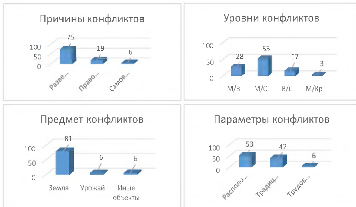
Рис. 3. Категории анализа конфликтов Данковского уезда 1918–1920 гг. (в % %) Fig. 3. Categories of analysis of conflicts in Dankov county in 1918–1920 (in % %)

лены следующие: земля, урожай и иные объекты (сад, сенокос, пруд, разработка камня). Категория «параметры конфликта» охватывает три элемента: расположение (дальний – близкий, черезполосный, в границах дачи селения и т. д.), традиции пользования (пользование ранее купленной или арендованной землей, или иным объектом, справедливость пользования), трудовые усилия (труд, вложенный в тот или иной объект). Анализируемые данные представлены в процентном отношении (рисунк 3).