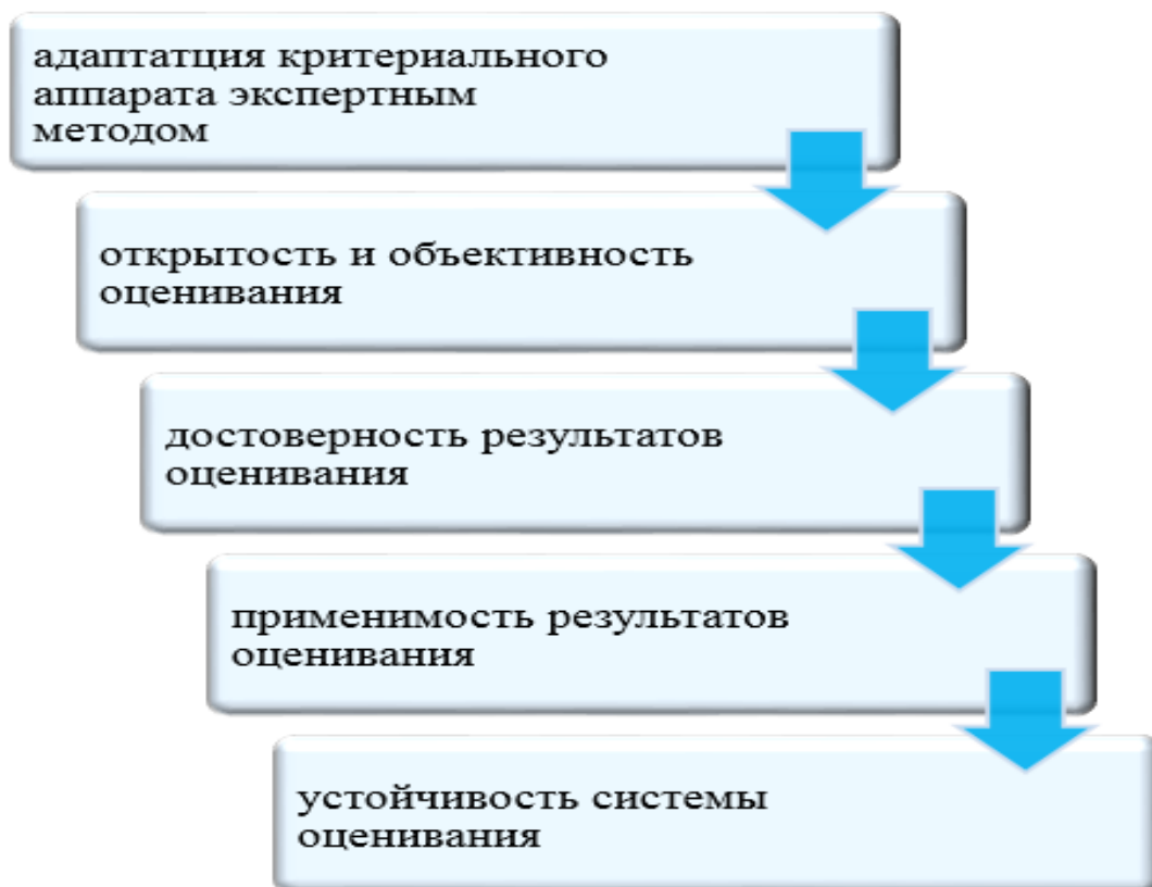
Рис. 4. Процесс воздействия ситуационного экспертного анализа руководителей отраслевых муниципальных подразделений (авторский научный результат) Fig. 4. The process of influencing the situational expert analysis of heads of sectoral municipal units (author's research result)

Логическая последовательность выводов по реализации предложения внесения изменений с применением механизма адаптации приводит к подтверждению рабочей гипотезы.