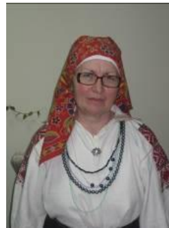
Рис.3. Станок с ластовками

В праздничных рубахах был отложной воротник с прямыми уголками. Рукава были заужены и присборены в очень мелкую складочку (что еле-еле пролезает рука) «брыжжи», украшенные лентами, кружевами, блестками, вышивкой. Рубахи шились с ластовками и без них. Характерным и устойчивым признаком рубахи были её украшения и нарядная отделка. Количество украшений зависело от назначения рубахи и возраста их владелицы: повседневная, праздничная, девичья, молодой замужней женщины.