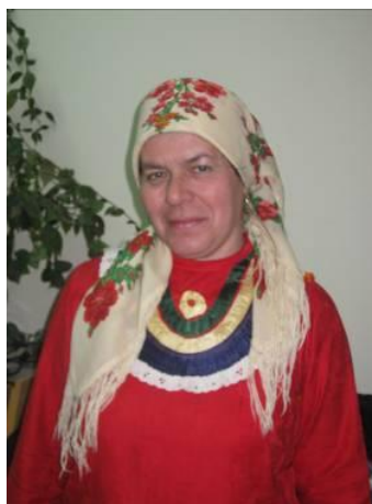
Рис.9. Кофта («кохта»)

Нарядной женской рубахой более позднего происхождения является распашная сатиновая или атласная кофта («кохта») (рисунок 9), украшенная спереди разноцветными лентами и застёгивающаяся на боку, на пуговицу. Кофту носят, не заправляя в юбку. Сначала надевают длинную холщовую рубаху, затем юбку, завеску, подвязывают пояс, а потом сверху надевают кофту. Украшением служило множество бус.