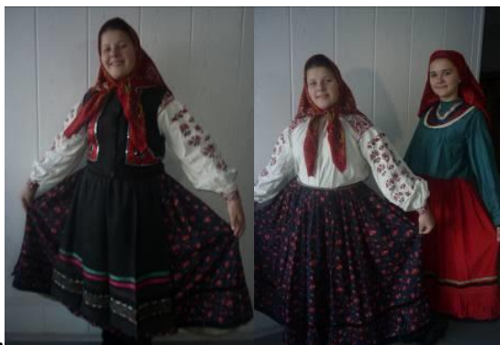
Рис. 4. Кубовая и сатиновая юбки

шерстяной ткани фабричного производства. Юбка носилась с белым вышитым станком, имевшим отложной воротник.