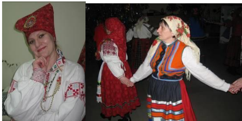
Рис.10. «Хранцузский» Рис.11. Шерстяной платок или коймистый платок

В будние дни крестьянки покрывали голову простыми платками – белыми или клетчатыми, холщовыми, ситцевыми, небольшими по размеру. В праздничные дни они надевали платки ярких расцветок с нарядными кистями, бахромой. Особенно любимыми были в крестьянском быту ситцевые красные набивные платки с мелким цветным узором, которые назывались «хранцузскими» (рисунок 10), «с коймами» (из них женщины делали кокошники). Очень популярны были нарядные шерстяные платки разного цвета (рисунок 11). В холодное время женщины поверх платка надевали большие суконные шали.