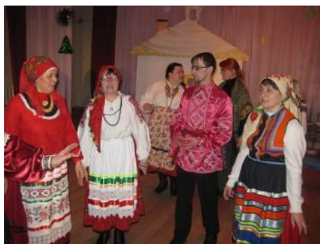
Рис.12. Фольклорный ансамбль « Истоки» Тростенецкого Дома Культуры Новооскольского района Белгородской области

Народная одежда села Тростенец является нашим богатейшим достоянием, частью нашей духовной культуры, неисчерпаемым источником изучения исторического прошлого населения нашего края, его мировоззрения, национального самосознания, а также художественно-эстетических взглядов (рисунок 12).