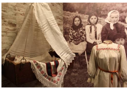
Рис.1. Элементы детской одежды

Детская одежда в Тростенце, как и на всей Белгородчине, была одинаковой – длинная, до пят холщовая рубаха с пояском. Ворот (ожерёлок), обшлага рукавов и подол украшался скромной вышивкой. Мальчики и девочки-подростки донашивали одежду своих старших братьев и сестёр – рубахи, портки, зипуны. Нередко им шили рубахи из старых отцовских и материнных. Первую «взрослую» одежду (юноша – штаны, девушка – юбку) дети получали, достигнув возраста, когда могли жениться и выходить замуж. Любящие матери всегда старались украсить детскую одежду. Вышивка обладала в древности оберегающим смыслом (рисунок 1).