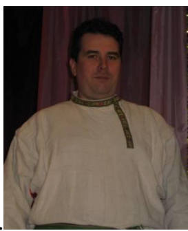
Рис. 2. Рубаха «косоворотка»

Штаны делались не слишком широкими: на сохранившихся изображениях они обрисовывают ногу. Кроили их из прямых полотнищ, а между штанинами («в шагу») вставляли ластовицу – для удобства ходьбы: если пренебречь этой деталью, пришлось бы семенить, а не шагать. Другое название одежды для ног – «портки».