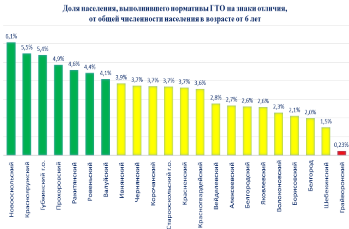
Рис. 4. Доля населения, выполнившего нормативы ГТО на знаки отличия, от общей численности населения в возрасте от 6 лет.

Запланированный бюджет, в рамках реализации комплекса ГТО, был выполнен в полном объеме. Общий бюджет проекта составил 10 млн. 822 тыс. рублей; из них федеральный бюджет – 2 млн. рублей; областной бюджет – 2 млн. 150 тыс. рублей; местный бюджет – 6 млн. 700 тыс. рублей.