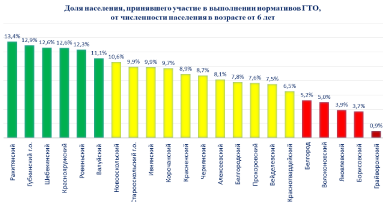
Рис. 3. Доля населения, принявшего участие в выполнении нормативов ГТО, от численности населения, проживающего в муниципальных районах и городских округах в возрасте от 6 лет.

Возвращаясь к ситуации в Белгородской области, необходимо обратить внимание на то, что по доле населения, принявшего участие в выполнении нормативов комплекса «ГТО» (от общей численности населения, проживающего в муниципальных районах и городских округах в возрасте от 6 лет), лидерами стали (перечисляются по мере уменьшения числа участников): Ракитянский, Шебекинский, Краснояружский, Ровеньской, Валуйский районы, а также Губкинский городской округ, а аутсайдером - Грайворонский район. (Рис.3)