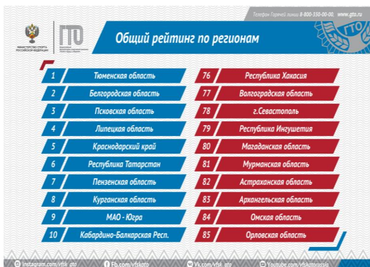
Рис. 1. Общий рейтинг по регионам по реализации программы выполнения ВФС «ГТО»

Правда, по итогам на октябрь 2018 года в этом рейтинге она опустилась на шестое место (после Тюменской, Воронежской, Пензенской, областей, Республики Татарстан, Чукотского автономного округа), с регрессом в 2 балла 1 .