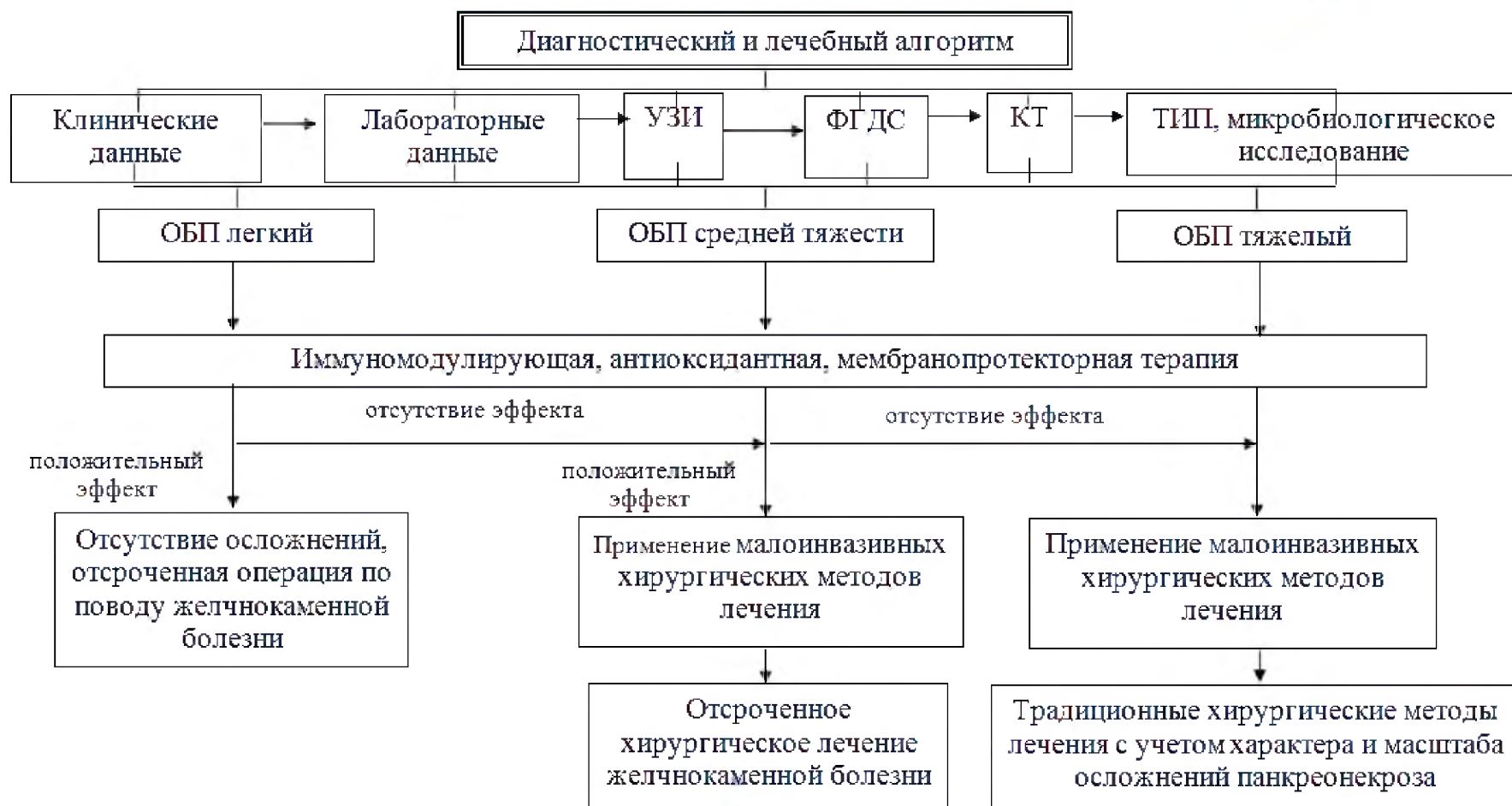
Рис. 2. Диагностический и лечебный алгоритм при ОП билиарной этиологии при проведении иммуномодулирующей, мембранопротекторной и антиоксидантной терапии