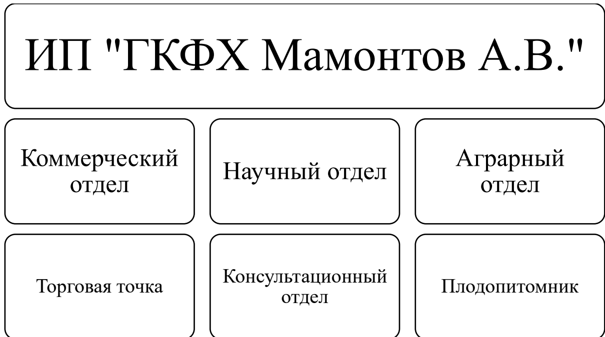
Рисунок 2.1 – Организационная структура ИП «ГКФХ Мамонтов А.В.»

Организационная структура включает несколько отделов (рисунок 2.1).