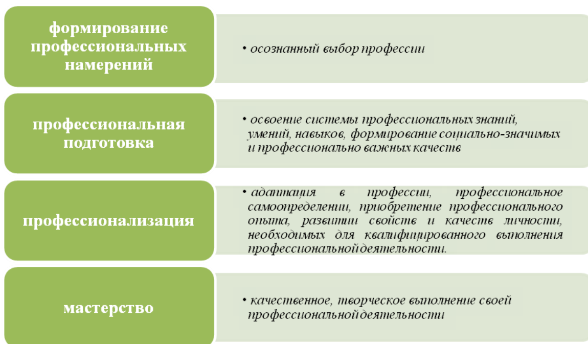
Рис. 3. Стадии профессионального становления по Э.Ф. Зееру Fig. 3. Stages of professional development according to E.F. Zeer