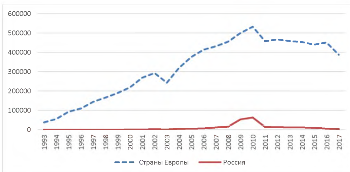
Рис. 1. Количество предприятий в России и Европе, сертифицированных по стандарту ISO 9001 на конец 2017 г.

Международная организация по стандартизации (ISO — International Organization for Standardization) проводит ежегодное исследование результатов применения стандарта ISO 9001 по всему миру «The ISO Survey». Согласно статистике, на конец 2017 года количество выданных сертификатов в России составляло 0,3% от общемирового, или 0,9% от сертификатов, выданных в Европе. Безусловно, это крайне низкий показатель.