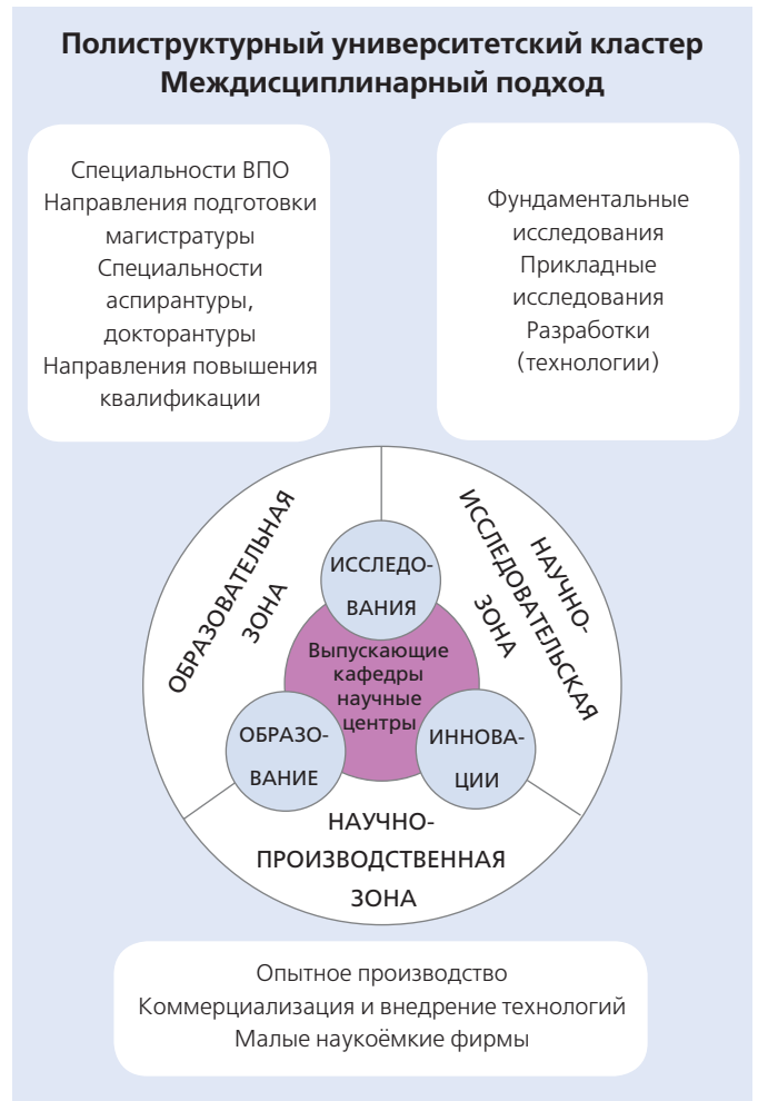
Рис. 1. Пример полиструктурного университетского кластера БелГУ

дирования Земли в экологии и рациональном природопользовании):