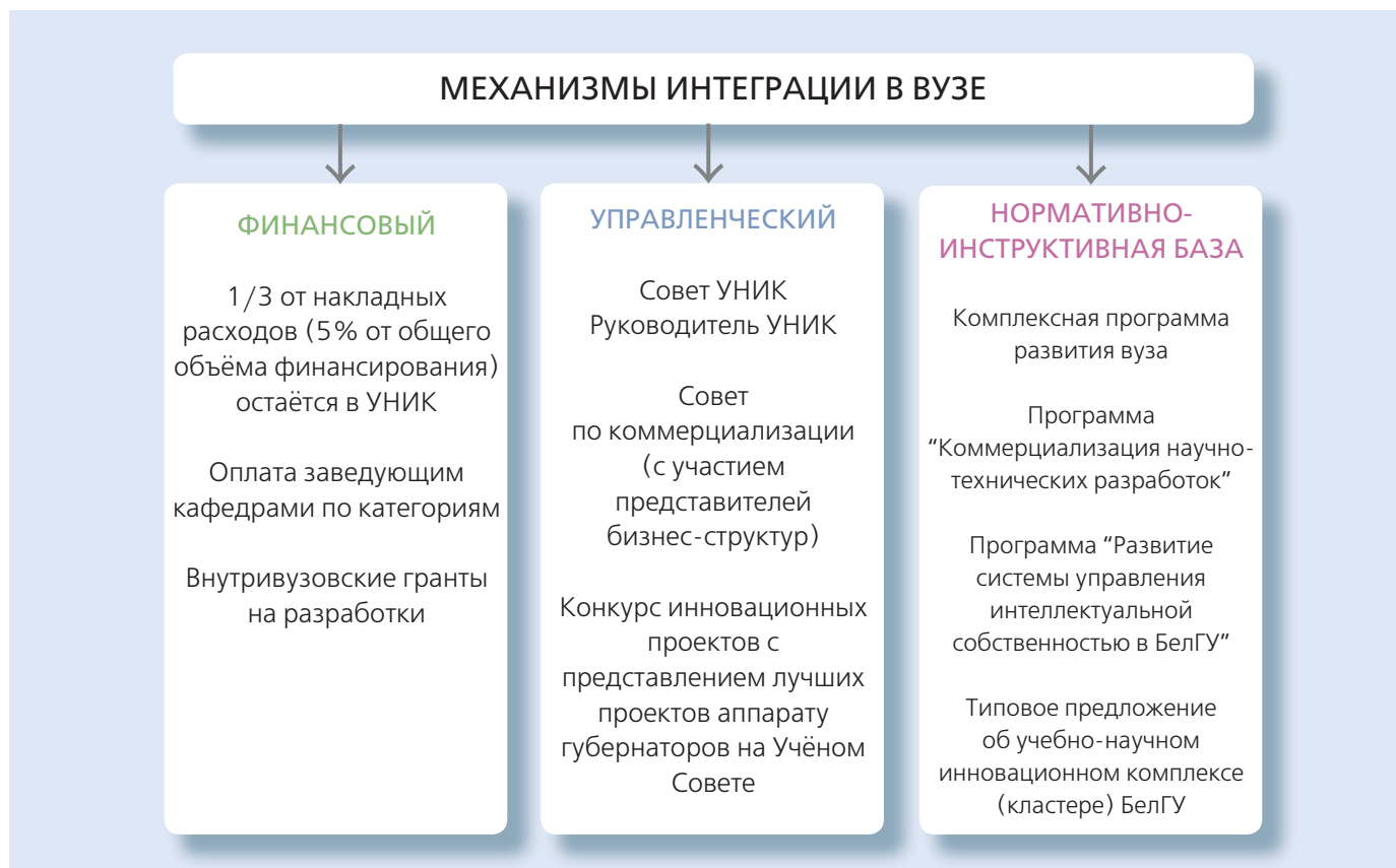
Рис. 3. Внутривузовские механизмы интеграции науки, образования и производства

В области фундаментальных исследований в рамках профильного УНИКа в 2007–2009 гг. выполнено 22 проекта, получивших финансовую поддержку по различным федеральным целевым программам, академическим и отраслевым программам, грантам РФФИ, а также по пяти международным грантам.