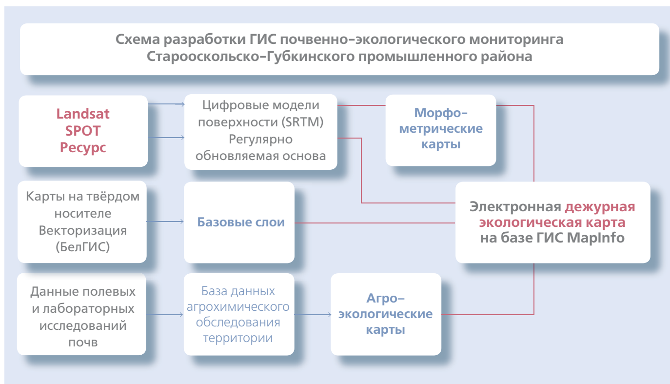
Рис. 4. Схема разработки ГИС почвенно-экологического мониторинга Старооскольско-Губкинского промышленного района

ландшафтно-экологического мониторинга земель в районах с высоким уровнем техногенного воздействия для обеспечения безопасности производства сельскохозяйственной продукции. Этот проект реализовывался учёными и студентами БелГУ с 2005 по 2007 гг. по заказу Администрации Белгородской области. В настоящее время он продолжается как совмещение экспедиции по гранту РФФИ «Мониторинг техногенного воздействия и рациональное природопользование в действующих и вновь создаваемых промышленных районах» и летней учебной геомониторинговой практики студентов на территории Курской Магнитной аномалии (КМА). В проекте впервые дана объективная, обоснованная с точки зрения современных ландшафтно-геохимических представлений, оценка экологического состояния почв в зоне влияния предприятий Старооскольско-Губкинского промышленного района.