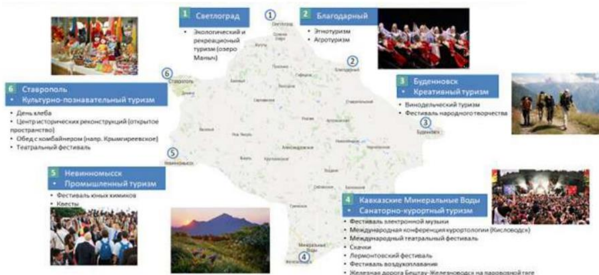
Рис. 1 Варианты структурирования туристического контура по разным видам туризма