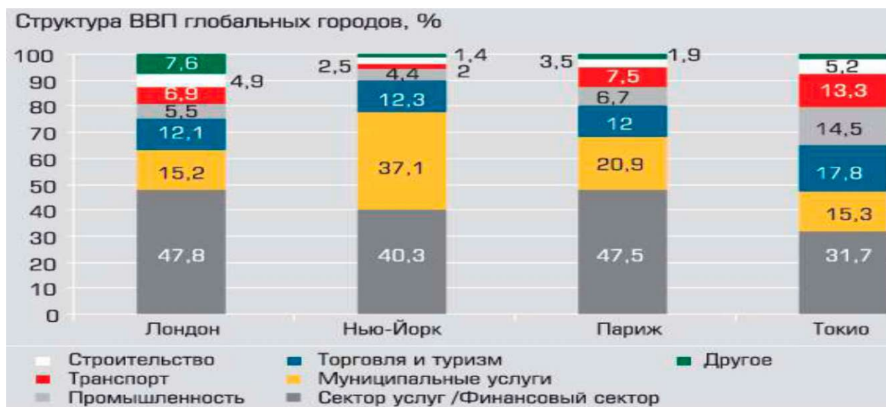
Рис.3. Структура ВВП глобальных городов Fig. 3. GDP structure of global cities

Из представленной на рисунке 3 диаграммы видно, что в структуре ВВП экономики мегаполисов (глобальных городов) наибольший удельный вес составляет также сектор услуг, что непосредственно подтверждает значимость сектора в структуре товарного производства на национальных рынках государств и стран мира.