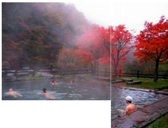
Рис.3. Зоны отдыха Арасан Уйгурского района Алматинской области Fig. 3. Recreation areas of Arasan Uygur district of Almaty region

Каждая зона отдыха имеет свой подъезд и открытую автомобильную стоянку внутри территории. Территории огорожены и озеленены. Основной вид рекреации - пассивный отдых. Большинство зон отдыха предлагают отдыхающим выезд к ближайшим природным достопримечательностям (Чарынский каньон, Ясенева роща и др.). Также можно посетить Бартогайское водохранилище. В единичных случаях предлагается рыбалка и езда на квадроциклах.