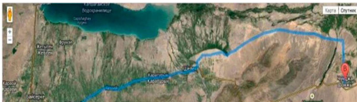
Рис. 2. Дислокация территории Арасанов Шонжы Уйгурского района Алматинской области