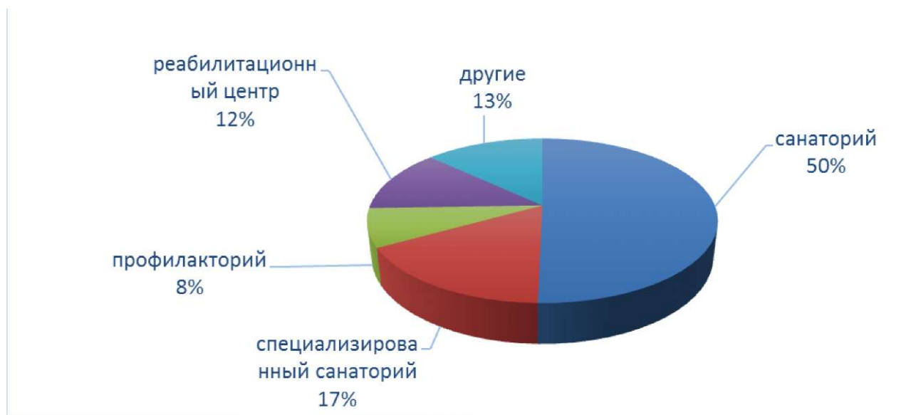
Рис. 1. Количество санаторно-курортных учреждений Республики Казахстан в 2019 году, единиц.

ческих ресурсов в стране сформирована соответствующая профильная лечебная база. Всего в Казахстане на сегодняшний день 145 организаций восстановительного лечения и медицинской реабилитации, ко- ечный фонд составляет 20228 койко-мест (рис. 1) (Официальный сайт Комитета по статистике РК, 2020).