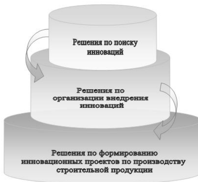
Рис. 1. Формирование инновационных управленческих решений в строительном бизнесе