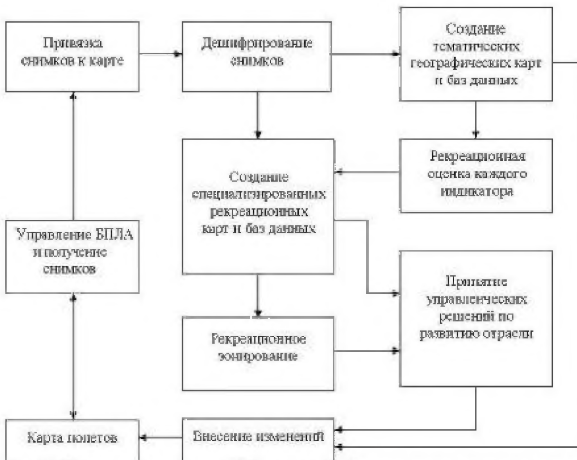
Рис. 1. Общая схема использования ГИС-технологий и беспилотных летательных аппаратов (БПЛА) в рекреационных целях

В настоящее время геоинформационные системы (ГИС) и аэро и фотосъемка активно используются в лесоводстве, что отражено в работах А.С. Исаева, М.Д. Брейдо, В.В. Фомина, Д.А. Старостенко, И.А. Вуколовой, Н.В. Мальшевой, К.Н. Кулика, А.С. Рулева, В.Г. Юферова и других. Первой специализированной системой созданной для управления лесными землями была – FORESTER [1], а позже были созданы модули расширения для базовых геоинформационных систем (ArcGIS, MapInfo и другие) для решения задач по учету и управлению ресурсами [2, 3, 4, 5]. Но, несмотря на все многообразие ГИС, они практически не используются в географическом изучении рекреационных ресурсов, хотя и рассматриваются в качестве основного инструмента развития туристической индустрии.