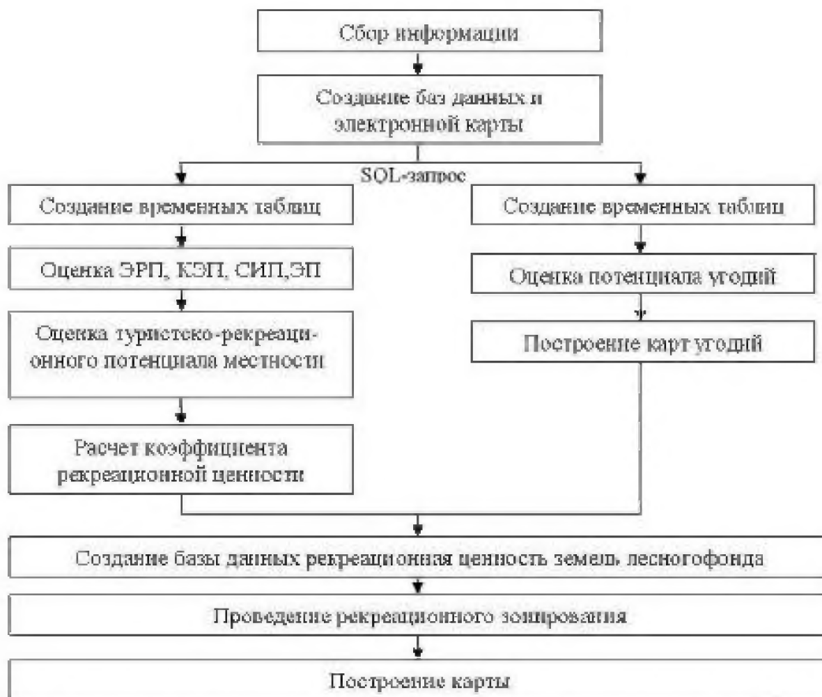
Рис. 3. Структурно-логическая модель рекреационной оценки земель лесного фонда Fig. 3. The structural and logical model of recreational assessment of forest grounds

Рекреационная оценка лесных территорий позволит учитывать состояние и возможности использования зеленых зон для восстановительно-оздоровительных целей, и выступит в