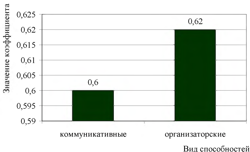
Рис. 2. Результаты исследования коммуникативных и организаторских способностей руководителя

Данные показатели свидетельствуют об уровне развития деловых качеств руководителя. Представим результаты, полученные после обработки данных методики «Коммуникативные и организаторские способности», на графике (рис. 2).