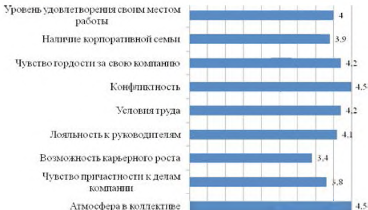
Рис. 2. Оценка составляющих корпоративной культуры «Метро»

Для определения уровня интегрального показателя социальной и экономической эффективности корпоративной культуры ООО «Метро» была использована следующая шкала (табл. 7).