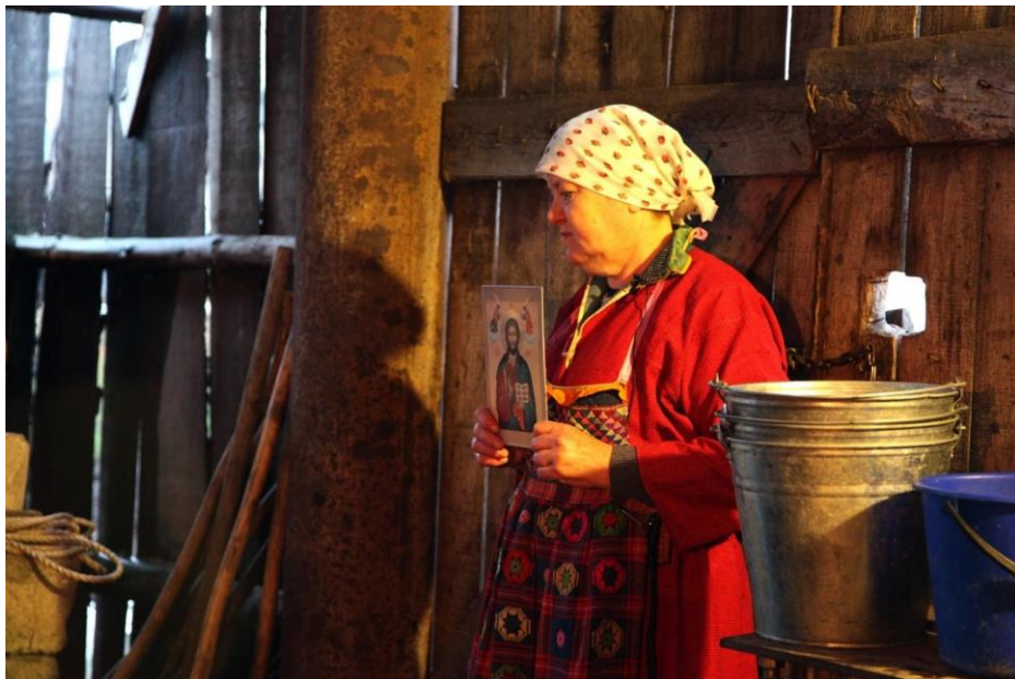
Поминальный обряд Аш бирэу . Попово Obit Аш бирэу . Popovo

Дружественность–соперничество. У нагайбаков оформились собственные «дипломатические» стратегии во взаимодействиях с соседними этническими группами. С одной стороны, нагайбаки отмечают близость с другими народами: согласно их представлениям, они связаны родством с ногайцами, арабами, турками, гагаузами и др. Нагайбаки рассказывали об ощущении родства по языку с татарами или башкирами, если они находятся в ином (чаще всего русскоязычном) окружении, или о близости по религии с русскими (к примеру, если они в окружении мусульман). Родственная связь нагайбаков с другими народами часто «обнаруживается» во время поисков истоков собственной этничности. Такое родство условно и зависит от конкретной ситуации и контекста.