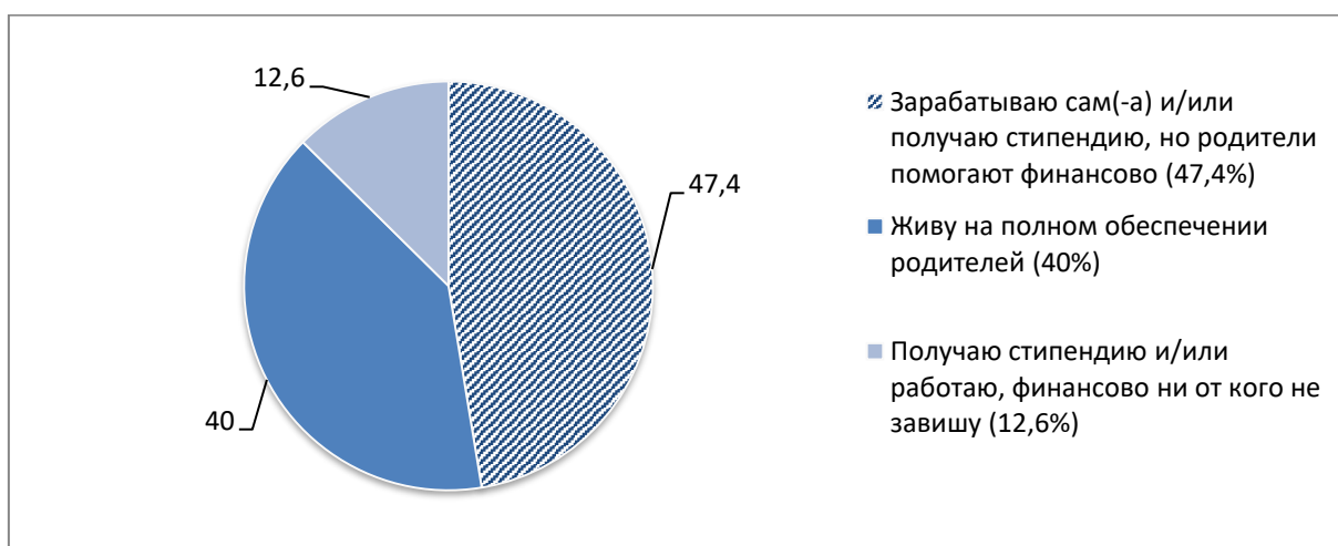
Диаграмма 2. Распределение ответов на вопрос: «Укажите, пожалуйста, основной источник Ваших финансовых доходов?», %

В ходе обработке данных видим, что факторы, оказывающие влияние на решение студента вступить во вторичную занятость еще на этапе обучения в вузе, очень тесно зависят, от материального положения его семьи, а еще от его индивидуальных установок. Отталкиваясь от вышеописанной взаимосвязи, было принято решение об исследовании и главного источника финансового заработка работающих студентов. В целом, обучающиеся стремятся к обретению своего дохода, чтобы не опираться на семейный. Вспомогательным источником дохода является денежная выплата в виде стипендии, а еще разные подработки. Общее распределение можно наблюдать в Диаграмме 2.