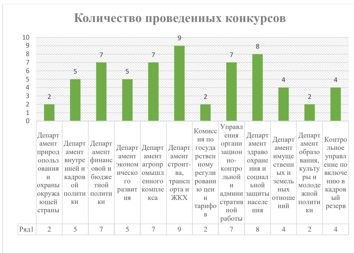
Рис. 2. Количество конкурсов, проведенных на замещение вакантной должности Института стажерства.

Таким образом, мы можем сделать вывод, что наибольшее количество конкурсов было проведено в департаменте строительства, транспорта и жилищно-коммунального хозяйства, а именно 9 конкурсов (с учетом несостоявшихся).