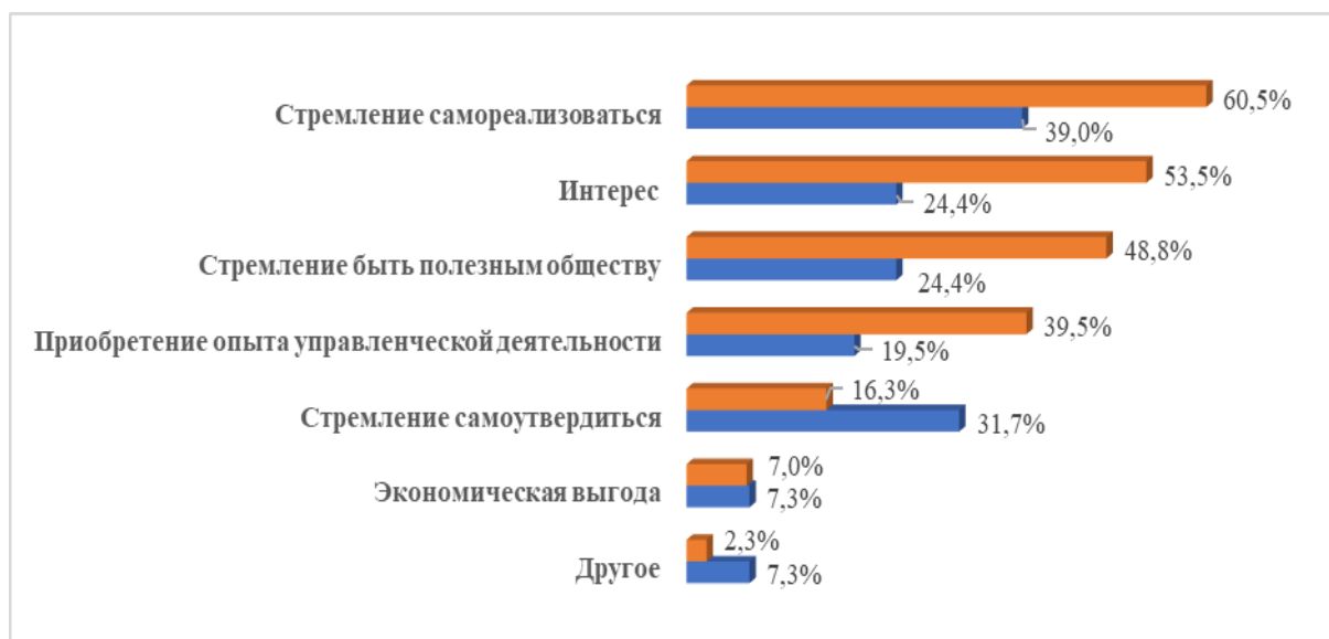
Рис. 1. Изменение интенсивности факторов, побуждающих профсоюзного лидера к его активной деятельности в зависимости от места и времени опроса Fig. 1. Changes in the intensity of factors that encourage the trade Union leader to be active, depending on the place and time of the survey

При переходе от одного хронотопа к другому интенсивность проявления основных факторов уменьшилась в 1,5-2 раза (табл. 1), а структура факторного пространства практически осталась неизменной, за исключением одного фактора – стремления самоутвердиться (см. рис. 1).