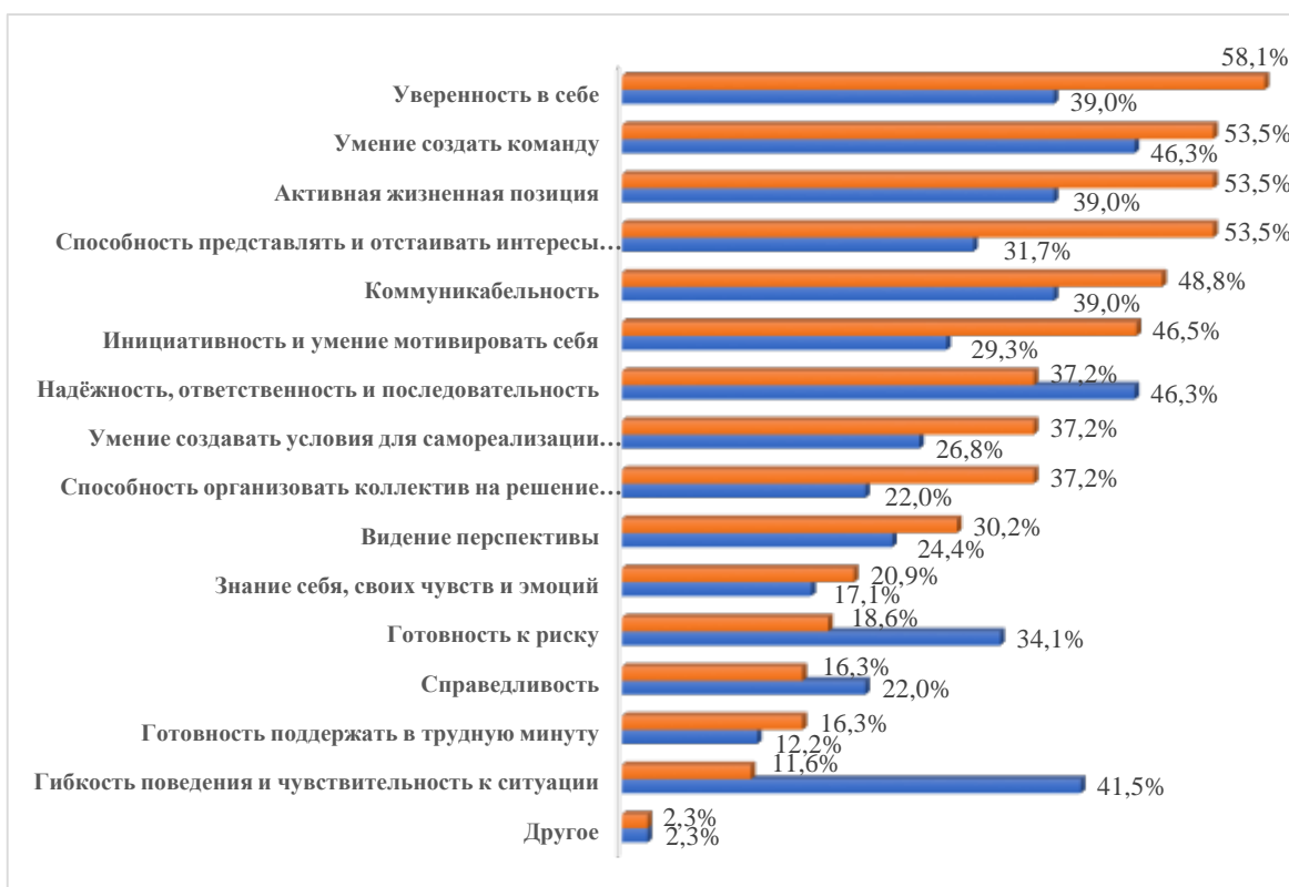
Рис. 2. Изменение уровня актуализации личностных качеств профсоюзного лидера, побуждающих его к активной деятельности в зависимости от места и времени опроса Fig. 2. Changes in the level of actualization, personal qualities of the trade Union leader that encourage him to be active, depending on the place and time of the survey

В реальных условиях трудовой деятельности молодого лидера актуализация около 70 % перечисленных личностных качеств, необходимых для эффективной профсоюзной деятельности, существенно снизилась (в 1,15–1,7 раза), а актуальность таких качеств, как надёжность, ответственность и последовательность, справедливость, готовность к риску, гибкость поведения и чувствительность к ситуации возросла (в 1,25–3,57 раза) (табл. 2).