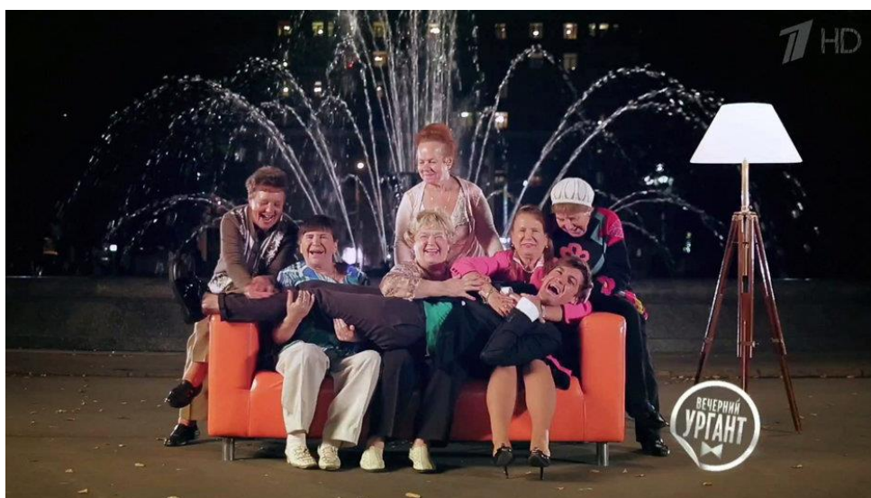
Рис. 2.9 Рубрика «Дамский клуб»

Выходила в третьем сезоне. Ведущий рубрики Александр Гудков вел разговор на различные темы с женщинами пенсионного возраста (см. рис. 2.9).