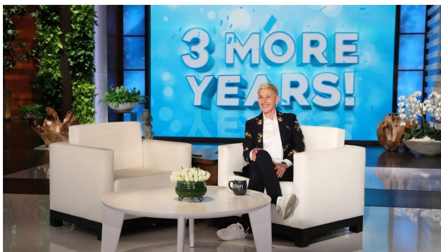
Рис. 2.1 Шоу «The Ellen DeGeneres Show»

«Ellen DeGeneres Show» – это американское развлекательное ток-шоу, одной из самых популярных в Америке (см. рис 2.1). Первый эпизод шоу вышел 8 сентября 2003 года, и на 2018 год всего насчитывается 16 сезонов и 3000 эпизодов (на май 2019 года). Первые пять сезонов шоу записывались в Studio 11 на NBC Studios, затем, начиная с шестого сезона, на Warner Bros. Studios, Burbank, California [The Ellen DeGeneres..., http:// ].