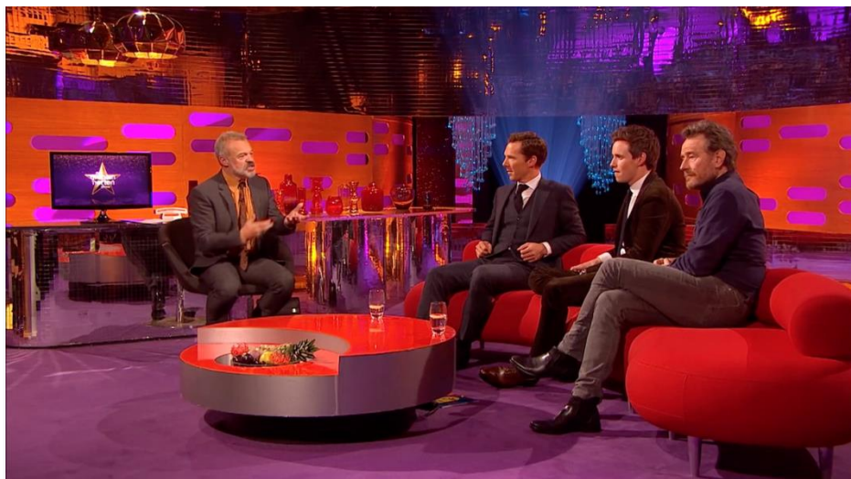
Рис. 2.5 Студия программы «The Graham Norton Show»

Студия шоу Грэма Нортона представляет собой большое помещение с подиумами посередине. На главном подиуме расположен красный диван для приглашенных знаменитостей, стул ведущего и стол с компьютером. Также, по традициям ток-шоу, присутствуют места для зрителей. Дизайн студии выдержан в красно-фиолетовых цветах (см. рис. 2.5).