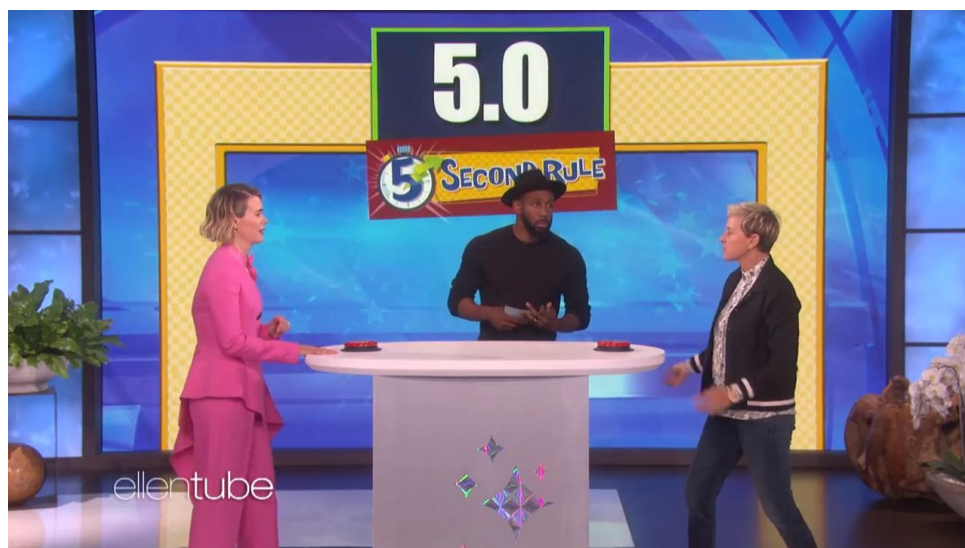
Рис. 2.4 Рубрика «5 Second Rule»