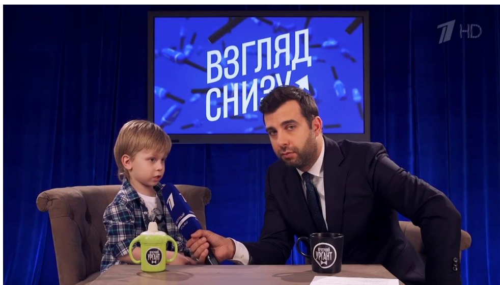
Рис. 2.8 Рубрика «Взгляд снизу»

Рубрика с участием воспитанников детского центра развития «ИМЕНА PRO». В ней ведущий задаёт детям вопросы на определённую актуальную тему, а они отвечают. В силу возраста ответы ребят получаются довольно смешными (см. рис. 2.8).