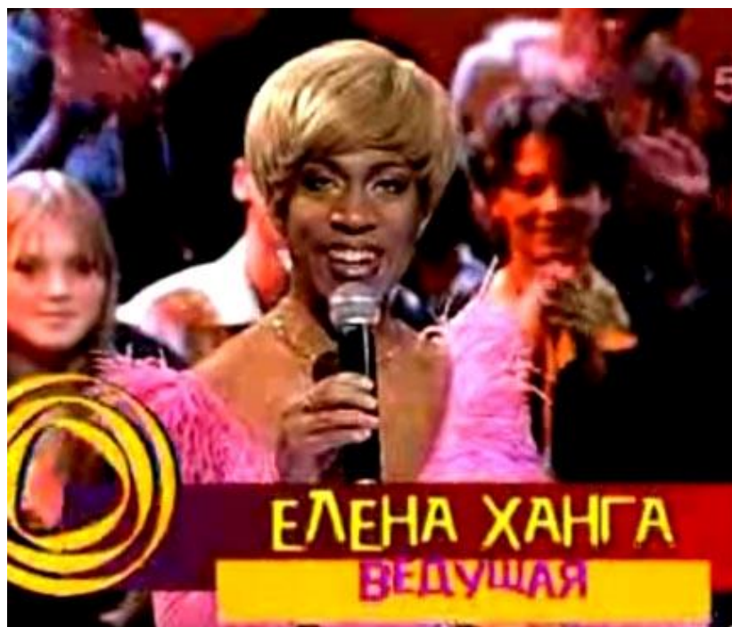
Рис. 1.1 Ток-шоу «Про это»

В 1996 создается первый представитель современного понимания жанра ток-шоу. На телеканале НТВ вышла программа «Про это» (см. рис. 1.1), которая стала настоящим примером своего жанра, а на ОРТ – программа В. Комиссарова «Моя семья». Эти два шоу можно назвать знаковыми, потому что именно после их выхода поменялось само понимание жанра ток-шоу и его формата. Нужно отметить, что в то время у программ была определенная общественная важность, которую сейчас практически не встретишь на современном ТВ. Политические темы нередко затрагивались ведущими, а в наше время обсуждаются в основном социальные и бытовые вопросы.