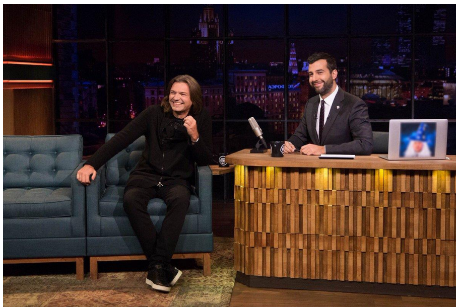
Рис.2.6 Ток-шоу «Вечерний Ургант»

«Вечерний Ургант» – вечернее развлекательное телешоу, которое выходит на «Первом канале» с 16 апреля 2012 года (см. рис. 2.6). Является своего рода российской адаптацией американского формата «Late night show». Ведущий программы – Иван Ургант.