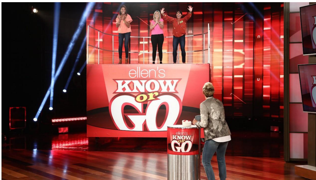
Рис 2.2 Рубрика «Know or Go»