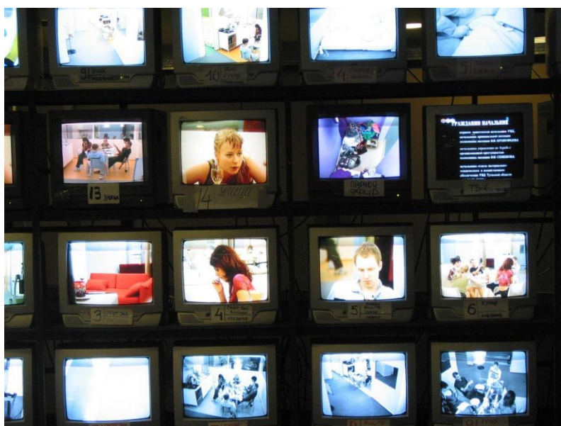
Рис. 1.2 Реалити-шоу «За стеклом»

Важным событием в российском ТВ стало появление первого реалити-шоу «За стеклом» в 2001 году (см. рис. 1.2). Поскольку ничего подобного зритель до этого не видел, программа получила высокие рейтинги, а ее участники стали очень популярными. В фильме Питера Уира «The Truman Show» (1998г.) мы можем наблюдать схожее явление – по ту сторону экрана многомиллионная аудитория следит за «реальной» жизнью человека, сидя дома перед телевизором. В реалити-шоу зритель мог и даже в какой-то мере решать судьбу участника, выбирая, кто покинет проект с помощью sms-голосования.