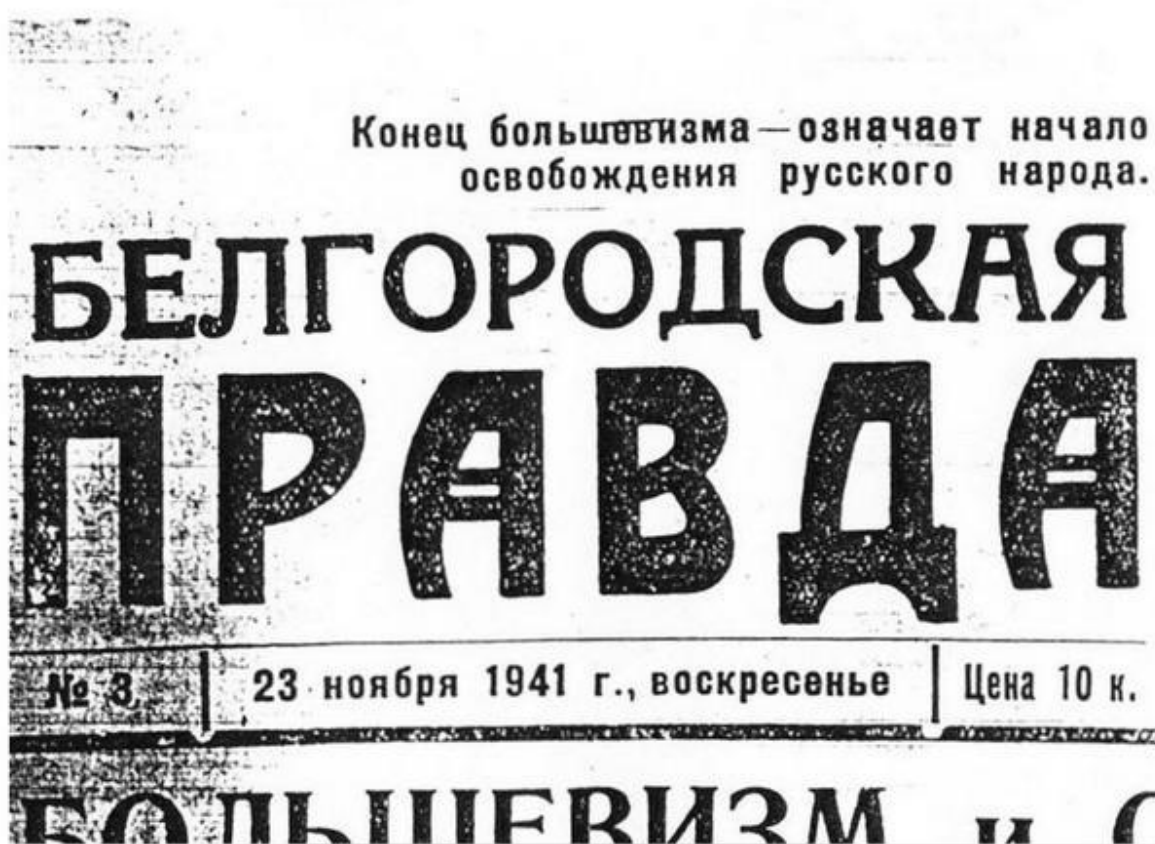
«Белгородская правда», газета оккупационного правительства № 3 от 23.11.1941.