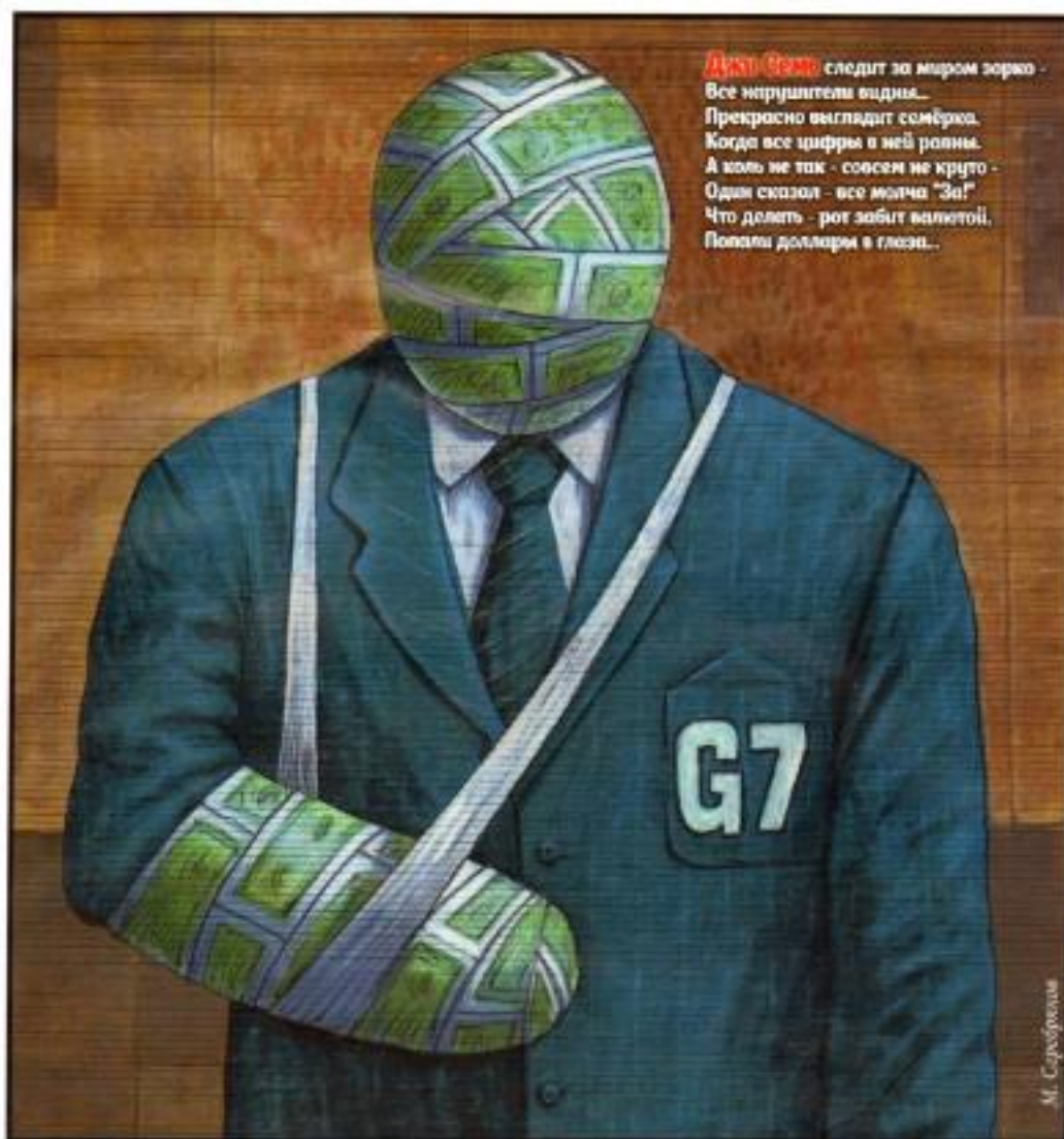
Рис. 2. «Пример использования Рисунка»

Инфографика, исполняемая в технике компьютерных диаграмм либо схем, по доходчивости зачастую опережает в том числе и наиболее подробную фотоиллюстрацию. Иногда инфографика становится более значимым компонентом полосы.