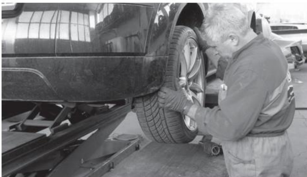
Рис. 1. «Пример использования фотографии»

Среди фотоиллюстраций распространены так называемые фотошампы — статичные, «клишированные» кадры.