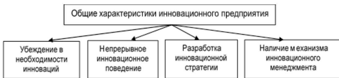
Рис.1.3. Составляющие деятельности инновационного предприятия

Кадровые инновации рассматриваются как подсистема общей системы управленческих инноваций в организации. Инвестирование в развитие людских ресурсов играет более огромную роль, нежели инвестирование в усовершенствование производственных мощностей. Значимость человеческого (интеллектуального) потенциала увеличивается с возрастанием скорости технологического прогресса, с развитием информационных технологий, усилением конкурентной борьбы и прочих условий. Значимость персонала на инновационном этапе экономического развития представлено на рис. 1.4.