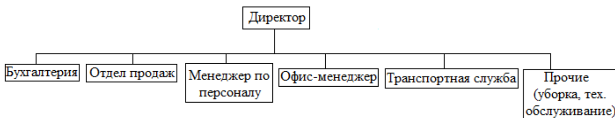
Рис. 2.1. Организационная структура ООО ТПО «Белторг»

Организационная структура торгового предприятия ООО ТПО «Белторг» представлена в виде схемы на рис. 2.1.