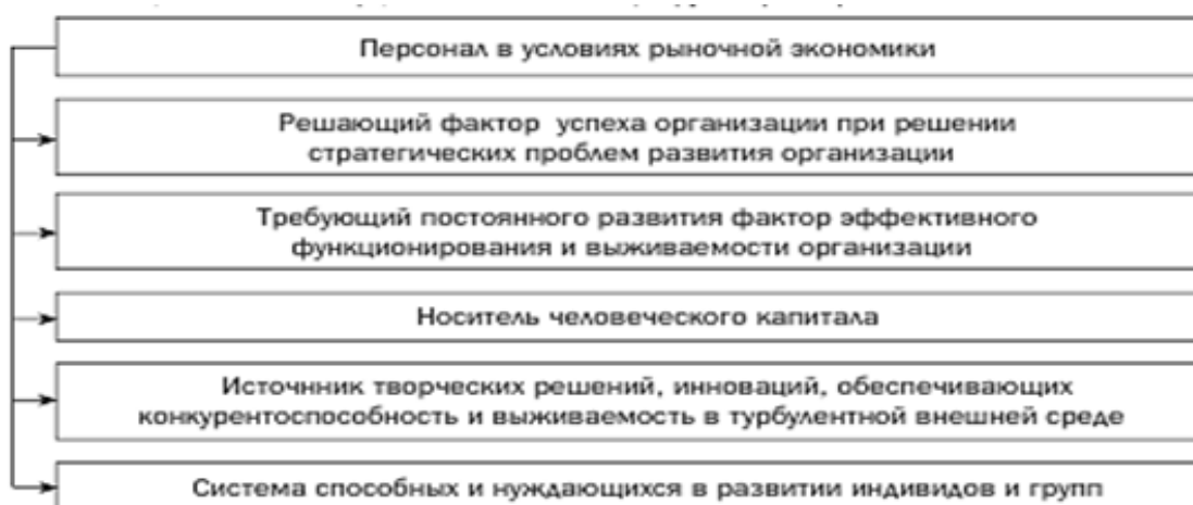
Рис. 1.4. Значимость человеческих ресурсов на инновационном этапе экономического развития

Кадровые инновации рассматриваются как подсистема общей системы управленческих инноваций в организации. Инвестирование в развитие людских ресурсов играет более огромную роль, нежели инвестирование в усовершенствование производственных мощностей. Значимость человеческого (интеллектуального) потенциала увеличивается с возрастанием скорости технологического прогресса, с развитием информационных технологий, усилением конкурентной борьбы и прочих условий. Значимость персонала на инновационном этапе экономического развития представлено на рис. 1.4.