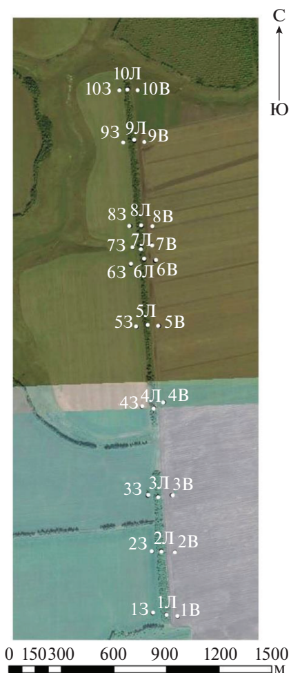
Рис. 1. Фрагмент космического снимка на ключевой участок исследования с указанием положения точек полевого опробования.

области, в окрестностях села Степное (координаты центра лесополосы – 50.9988^{\circ} с. ш., 37.3378^{\circ} в. д.). Климат территории умеренно-континентальный; согласно метеостанции, расположенной в селе Богородицкое (18 км к северу от участка исследования), среднегодовая температура составляет +7.5^{\circ}\text{C} ; среднегодовое количество осадков – 558 мм/год (за период с 2015 по 2019 гг.)