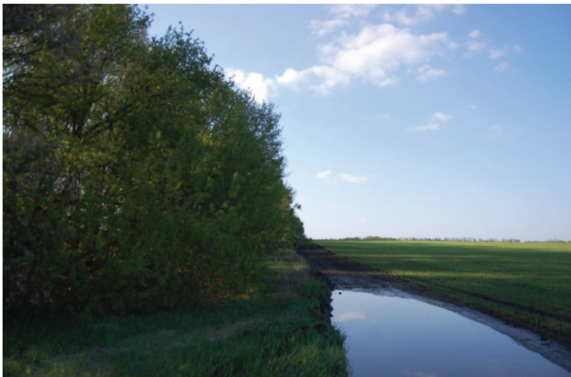
Рис. 3. Фрагмент лесополосы и “В поля” в мае 2019 г.

подстилаемым бескарбонатными глинами. Мощность верхнего субстрата в пределах участка исследований варьирует от 60 см до более чем двух метров. Глины встречаются на глубине менее метра в разрезах 7В, 23, 33, от 1 до 1.5 метров – в разрезах 3В, 4В, 4Л, 7Л, 73, 8В и более двух метров – в остальных случаях. Изменение мощности верхнего субстрата не обнаруживает согласованности с рельефом.