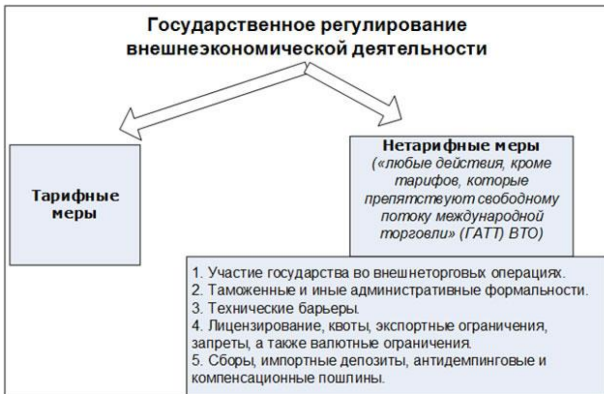
Рис. 1. Методы государственного регулирования ВЭД

товаров, при производстве или вывозе которых прямо или косвенно применялись субсидии. Такие пошлины используются, если ввоз товара причиняет или угрожает нанести материальный ущерб отечественным производителям, либо ограничивают организацию или расширение производства сходных товаров в РФ.