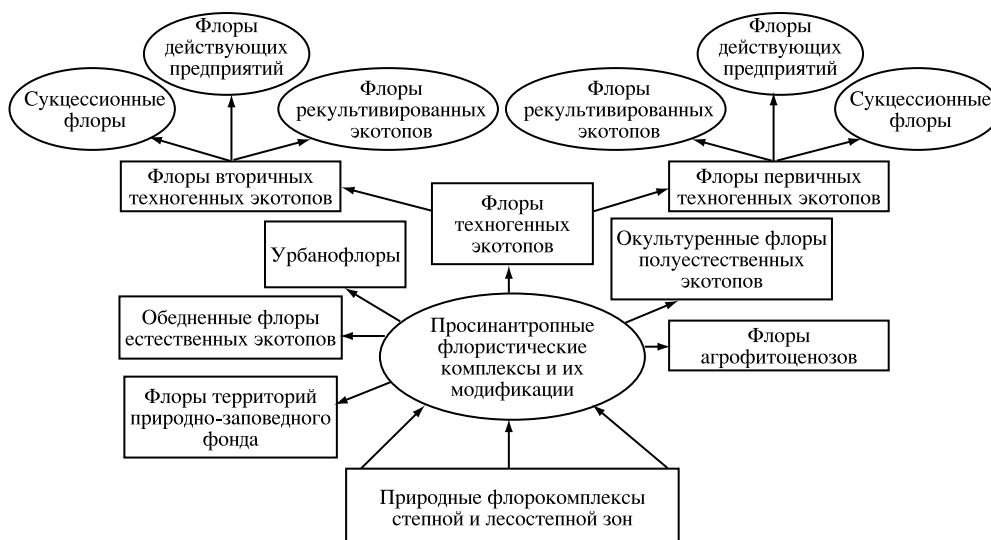
Рис. 1. Схема формирования флор при воздействии антропогенного фактора в степной и лесостепной зонах

способность к самовосстановлению. Такая флора становится искусственной, а произошедшие в ней антропогенные изменения – необратимыми.