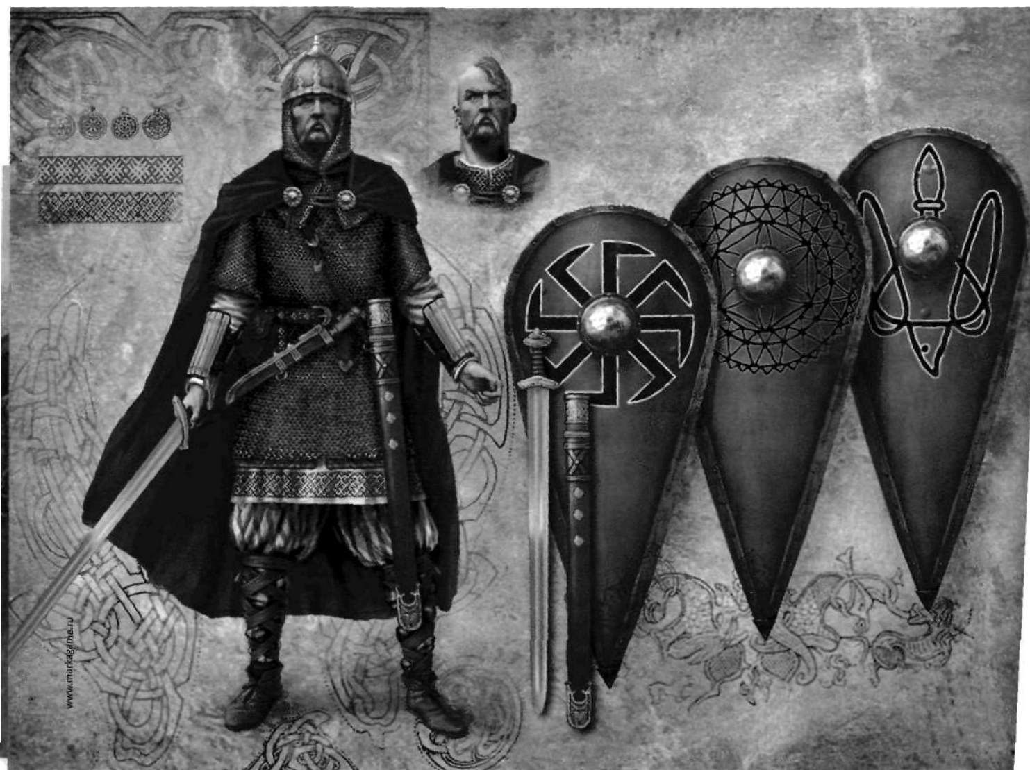
Научно-историческая реконструкция образа князя Святослава по описанию Льва Диакона

Но если отмеченные совпадения вовсе не являются случайностями, а отражают некую историческую закономерность, то, в таком случае, перед нами не просто военно-техническая революция, но речь необходимо вести о подлинной, хотя и локальной, военной революции. Классическая концепция военной революции, сформулированная М. Робертсом и уточненная Дж. Паркером, связывает воедино изменения в военной, социальной и политической сферах. В нашем же случае переворот в военном деле был связан с переходом от тактики ведения дистанционного боя в расcеянных боевых порядках с при-