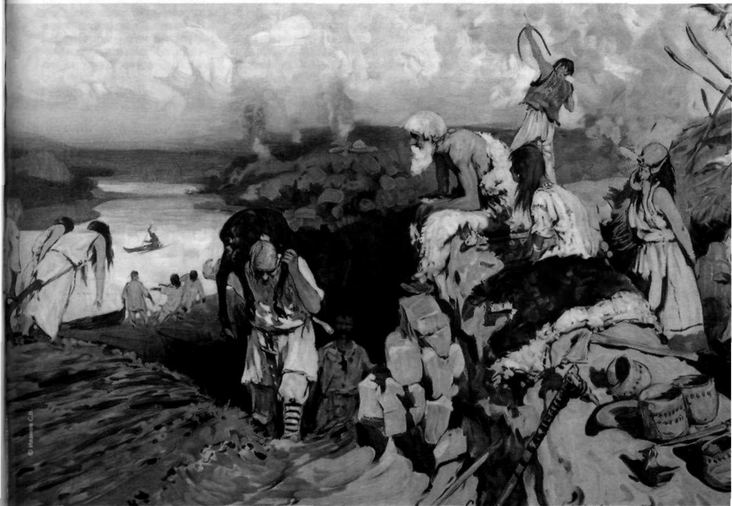
Жилье восточных славян. Худ. Иванов С.В. 1909

Более определенно характеризуют вооружение славян Прокопий Кесарийский и автор «Стратегикона» (традиционно считается, что им был византийский император Маврикий, правивший в 582–602 гг.). Реалии, отраженные в этих трактатах, были свойственны, судя по всему, славянам в середине – 2-й половине VI в. н.э. Прокопий, описывая вооружение славян, подчеркивал его чрезвычайную легкость — «вступая в битву, большинство из них идет на врагов со щитами и дротиками в руках, панцирей же они никогда не надевают» [21, с. 250]. О том же самом говорит и автор «Стратегикона»: «Каждый мужчина [славянский. — В. П.] вооружен двумя небольшими