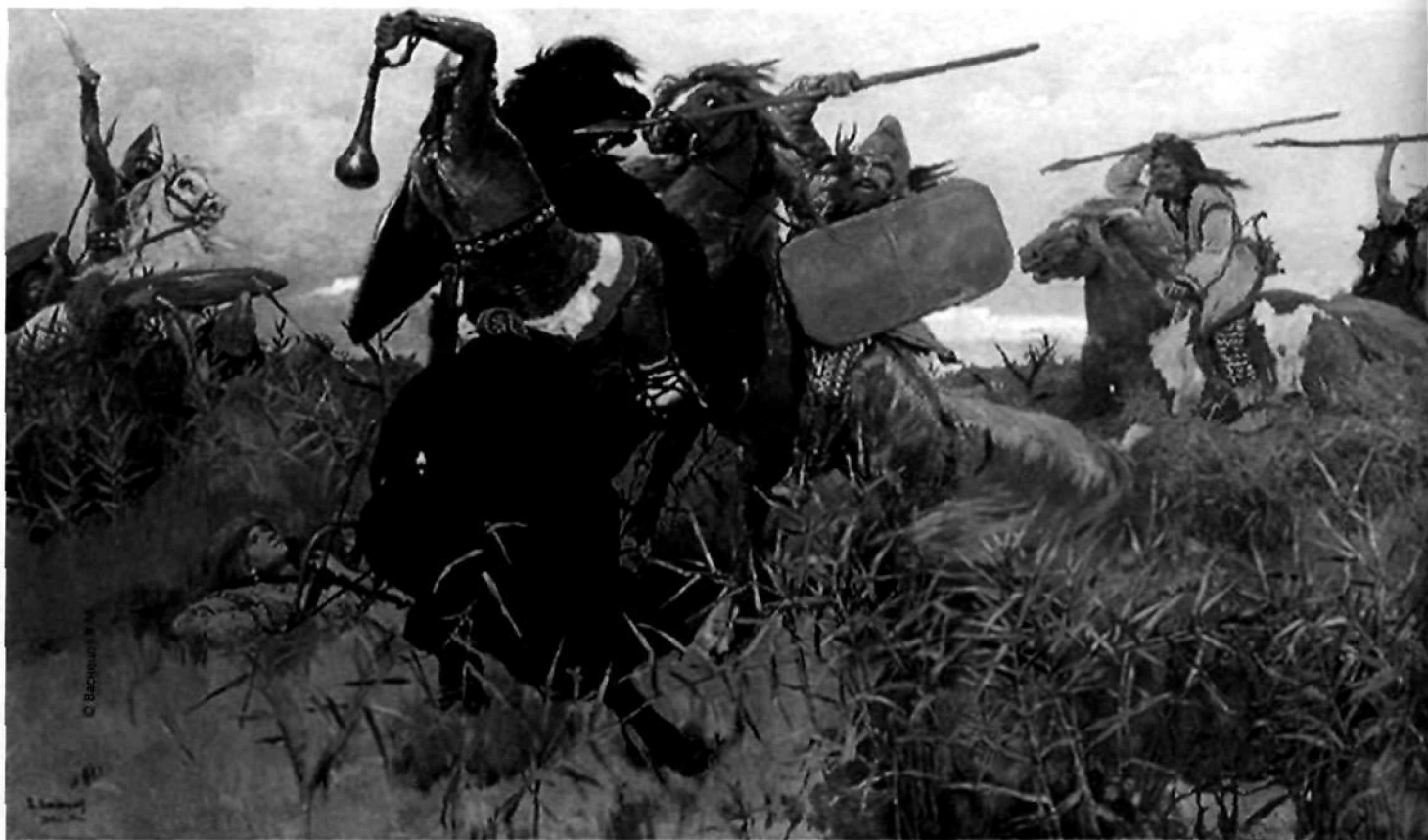
Битва скифов со славянами. Худ. Васнецов В.М.

В соответствии с комплексом вооружения была и тактика славян. Не останавливаясь подробно на этом вопросе, т.к. это уже было сделано А.К. Нефедкиным и рядом других авторов [18, с. 79–91], отметим лишь, что на поле боя для них было характерно стремление вести дистанционный бой посредством метания дротиков, прикрываясь щитами (обычными и/или стационарными ростовыми — этот вопрос требует дополнительного изучения). Лук, который, судя по все-