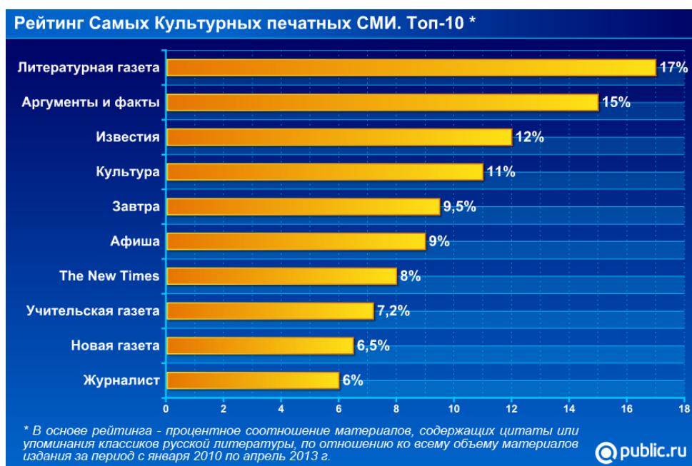
Рис. Рейтинг самых культурных печатных СМИ. Топ-10

Первую позицию рейтинга «Культурных СМИ» вполне ожидаемо занимает «Литературная газета» – цитаты и упоминания писателей встречаются в 17 публикациях из 100. На втором месте рейтинга «Культурных СМИ» находится еженедельник «Аргументы и факты» – издание упоминает классиков русской литературы в 15 публикациях из 100. Третья позиция принадлежит газете «Известия» – ссылки на известные литературные имена есть в 12 публикациях из 100.