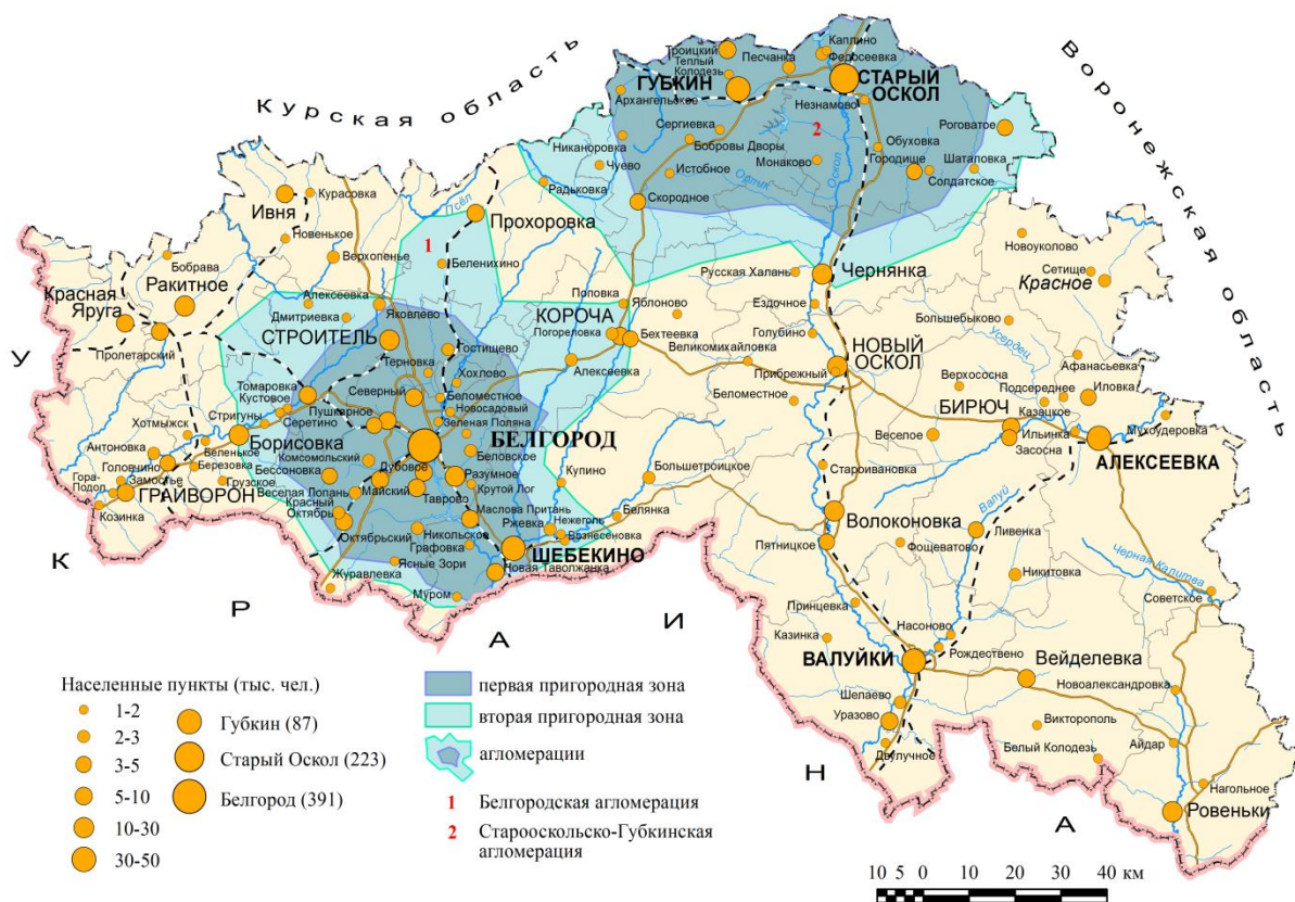
Рис. 2. Региональная система расселения Белгородской области (2018 г.)

О сложившейся региональной системе расселения дает представление рис. 2.