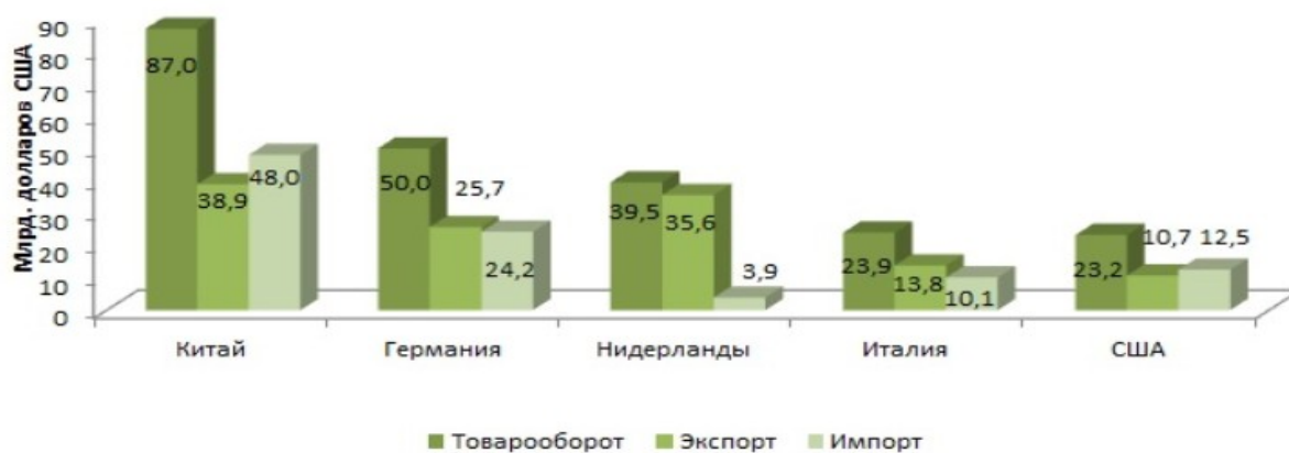
Рис. 1. Основные торговые партнеры Российской Федерации среди стран дальнего зарубежья в 2017 году

Следует отметить, отмечавшееся в 2013–2016 гг. снижение товарооборота России с ЕС прекратилось, и с 2017 г. начался стремительный восстановительный рост объемов взаимной торговли. Структура товарообмена принципиальных изменений не претерпела. В поставках товаров из России в ЕС по-прежнему главную позицию занимали товары сырьевой группы, прежде всего топливно-энергетические товары. В импорте доминировали машины и оборудование, химические товары и готовые изделия. Основными торговыми партнерами России в 2017 году были: Китай – 15% товарооборота Российской Федерации (рост – на 32%), Германия – 9% (на 23%), Нидерланды – 7% (на 22%), Беларусь – 5% (на 26%), Италия – 4% (на 21%), США – 4% (на 16%), Турция – 4% (на 37%), Республика Корея – 3% (на 28%), Казахстан – 3% (30%), Украина – 2% (на 26%). Приведем наглядно объемы внешней торговли с основными странами-партнерами.