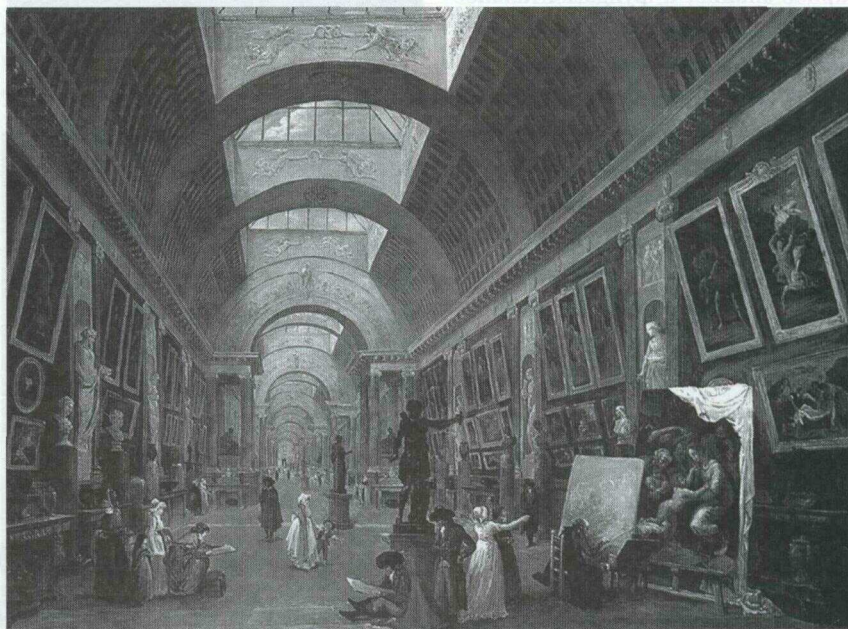
Юбер Робер. Главная галерея Лувра. Париж, Лувр, 1796 г.

Несмотря на то, что фундаментальная подготовка специалистов не нужна в массовом масштабе, она избирательно необходима для элитных компаний. Как известно, выпускники с фундаментальной естественнонаучной подготов-