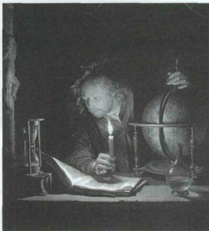
Геррит Дю. Астроном со свечой. Амстердам, Рейксмузей, 1665 г.

было произнесено много лет назад в одной из аудиторий этого, некогда славного университета: «Науки бывают естественные, неестественные и противоестественные».