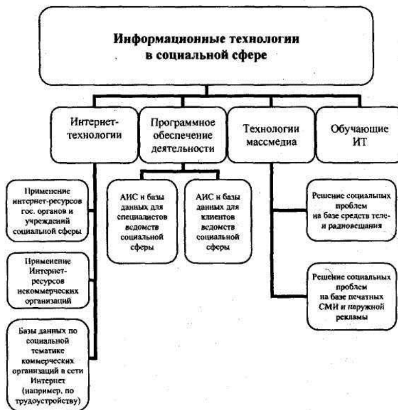
Рис. 1. Классификация информационных технологий в социальной сфере

В.М. Глушкова определяет информационные технологии как процесс, связанный с переработкой информации [23].