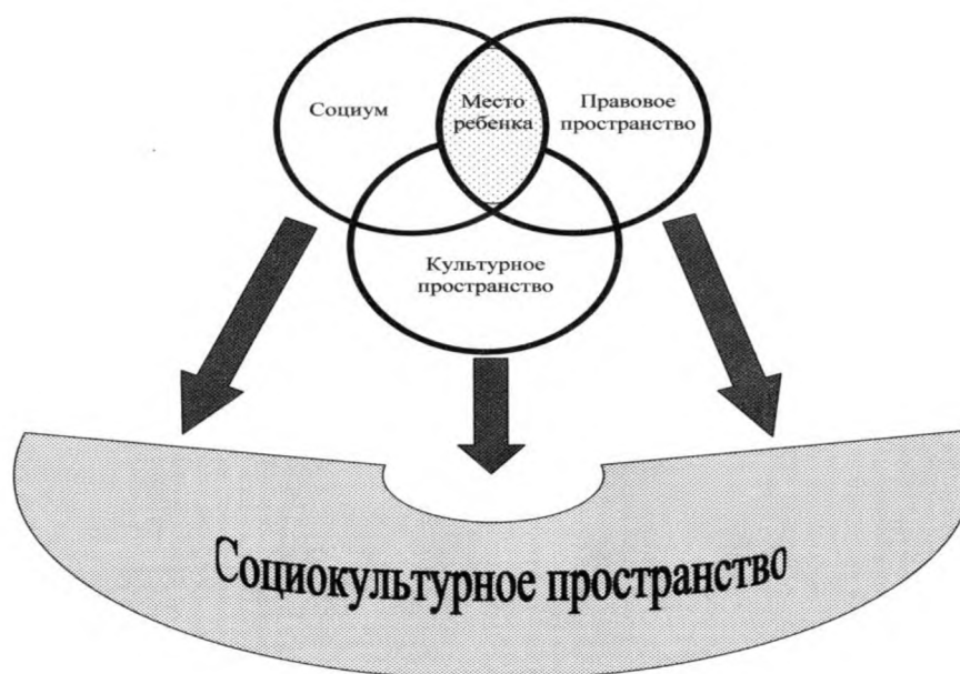
Рис. 1. Место ребенка как объекта социальной защиты

Радиус моделируемого пространства обозначен административными границами Белгородской области, однако, учитывая тот факт, что механизм