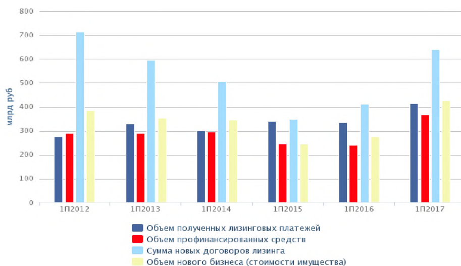
Рис. 1. Объемы стоимости имущества по лизинговым сделкам в России за 1 полугодие 2012-2017 годов