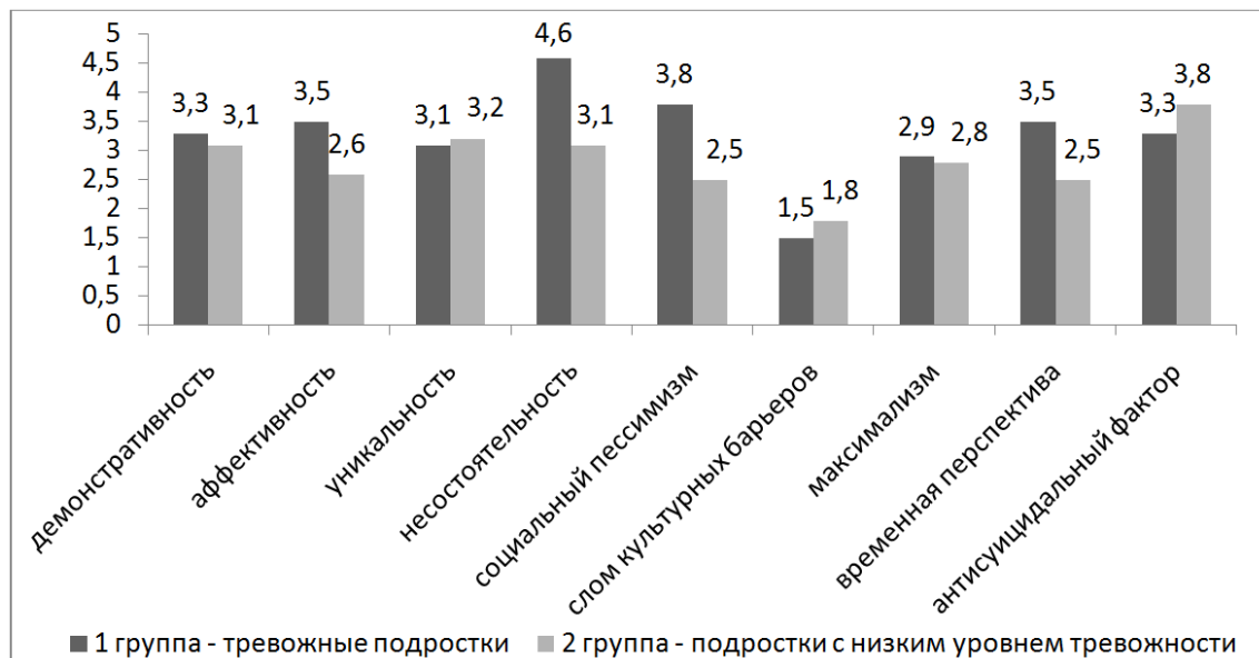
Рис. 2. Выраженность склонности к суицидальному риску у подростков (ср. знач.)

По результатам исследования выявили статистически значимые различия среди подростков с высоким и низким уровнем тревожности по шкалам «аффективность» ( U=358 , p \leq 0,05 ), «несостоятельность» ( U=424 , p \leq 0,05 ), «социальный пессимизм» ( U=382 , p \leq 0,05 ), «временная перспектива» ( U=367 , p \leq 0,05 ).