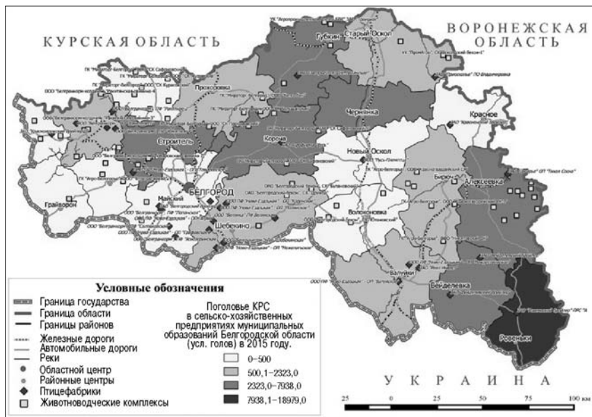
Рис. 3. Размещение животноводческих комплексов и птицефабрик Белгородской области.

Интенсивное развитие товарного животноводства приводит не только к загрязнению окружающей среды и росту антропогенной нагрузки на территорию, но и возникновению экологических рисков для здоровья населения [8], дискомфорту проживающего в районах комплексов населения из-за смрадных запахов.