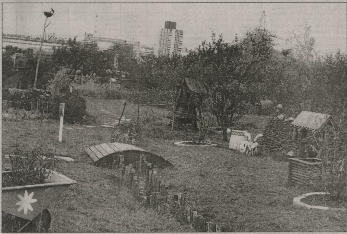
Колоритный уголок Ботанического сада БелГУ