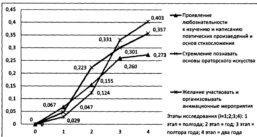
Рис. 1. Изменение средних значений мотивационных показателей в процессе развития творческой деятельности подростков

деятельность в рамках подготовки и проведения анимационных мероприятий и поэтических вечеров. Сочетание трех творческих направлений положительно сказалось на развитии творческих способностей подростков. Благодаря данным педагогическим обстоятельствам воспитанники на третьем этапе стали самостоятельно организовывать и проводить анимационные праздники, поэтические вечера и концерты. На четвертом этапе наблюдается плавное увеличение значений и довольно высокие цифры критериев и показателей, что демонстрируем нам формирование положительной мотивации к творческой деятельности подростков.