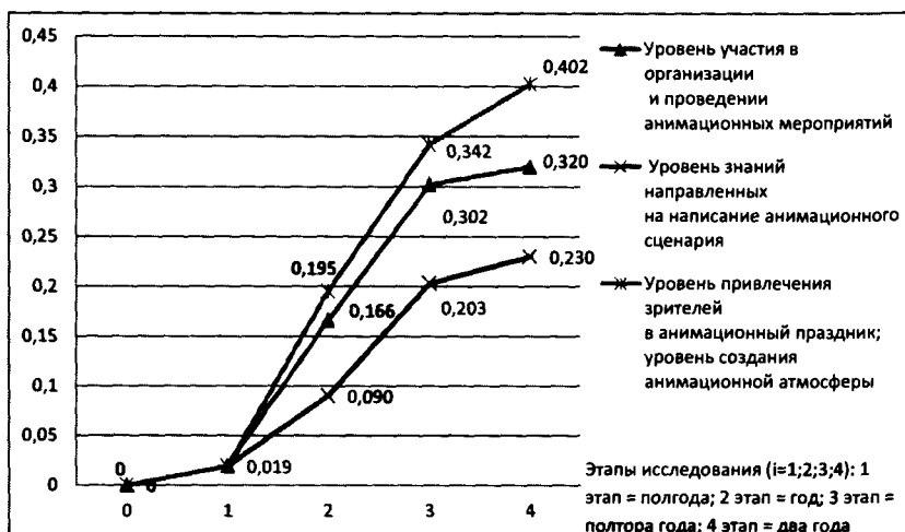
Рис. 2. Изменение средних значений анимационно-творческих показателей в процессе развития творческой деятельности подростков