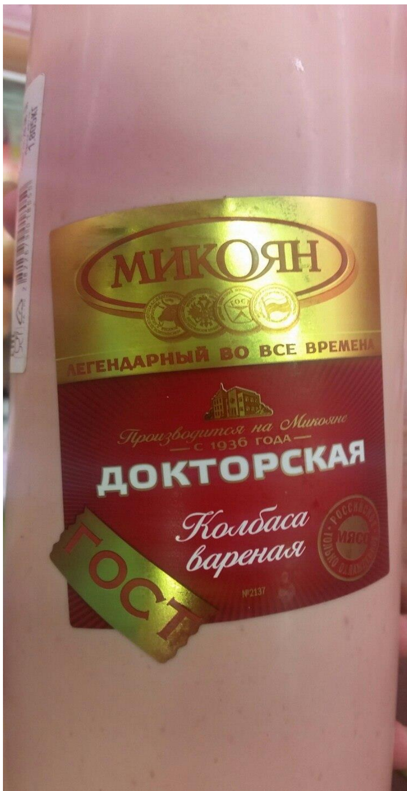
Рис. 2. Образец № 2 колбаса «Докторская» ЗАО Микояновский Мясокомбинат