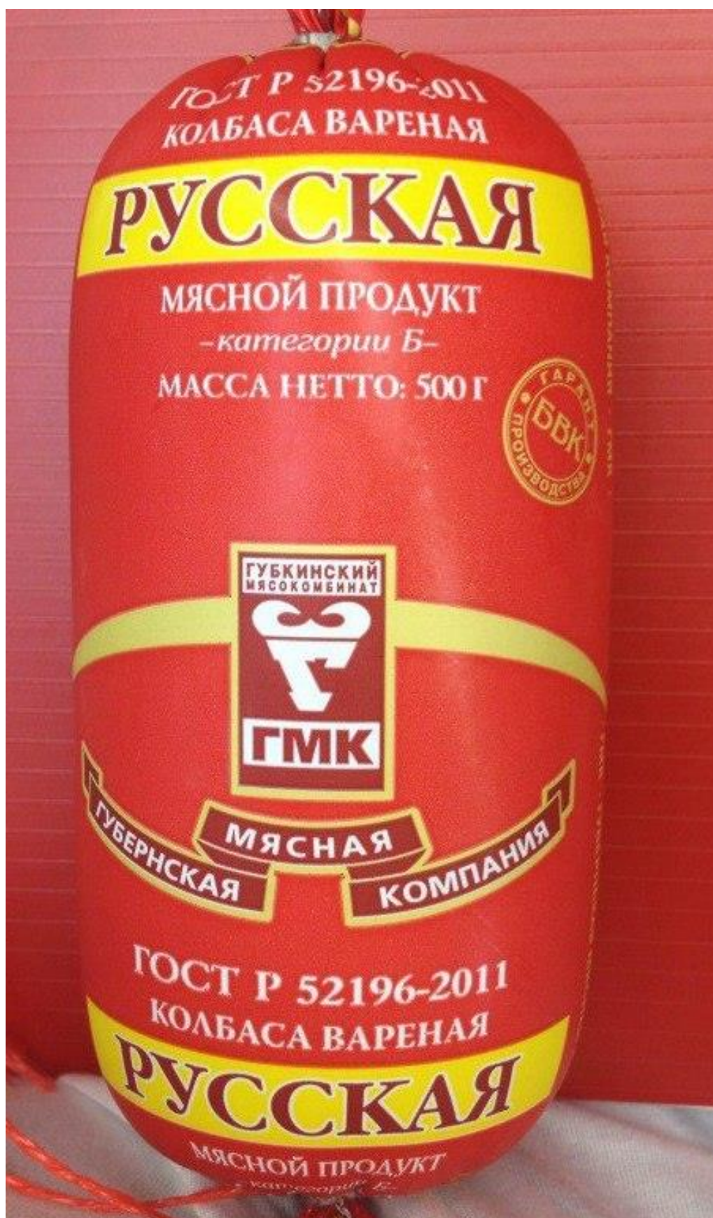
Рис. 1. Образец № 1 колбаса «Русская» ЗАО «Губкинский мясокомбинат»