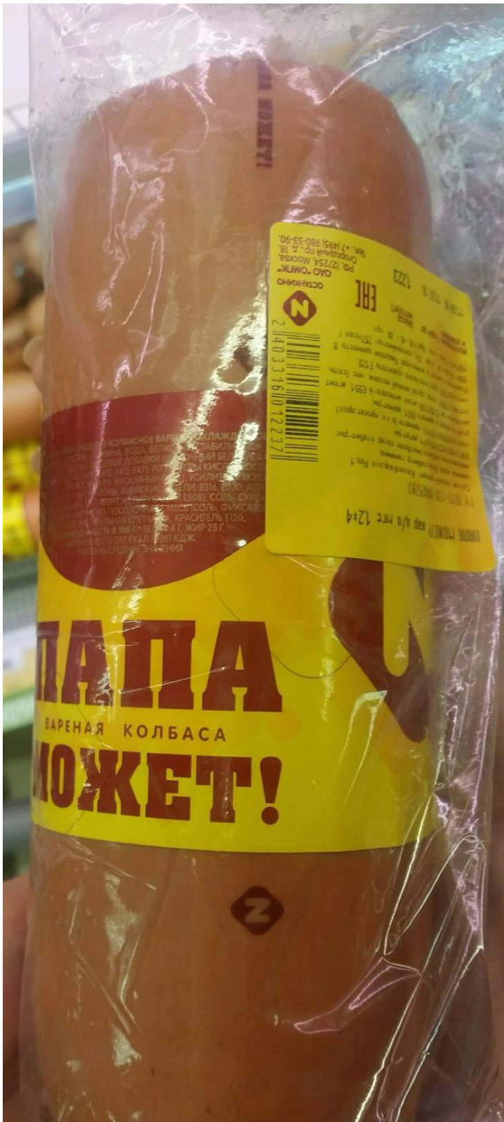
Рис. 3. Образец № 3 колбаса «Любительская» ОАО «Останкинский мясоперерабатывающий комбинат»