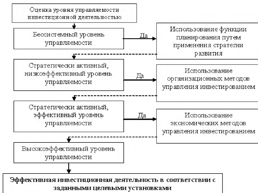
Рис. 3 Алгоритм выбора решений по управлению инвестиционной деятельностью в регионе

На первом уровне в алгоритме выбора решений предусматривается применение правительством области обязанностей по стратегическому управлению, в том числе: