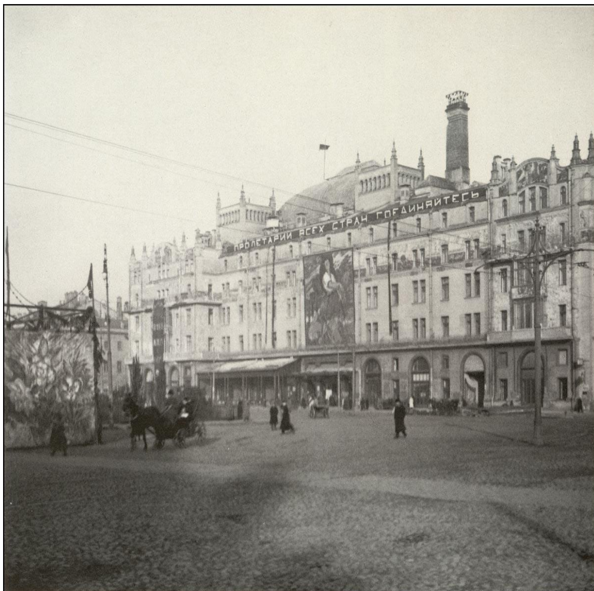
Рис. 3.2. Площадь Революции в Москве. На здании гостиницы «Метрополь» панно И.И. Захарова «Пролетарии всех стран, соединяйтесь!»