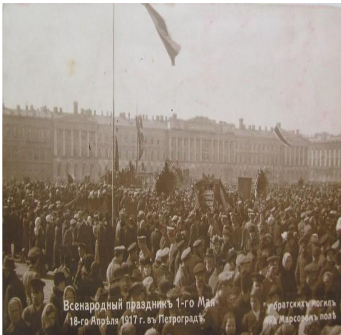
Рис. 5.3. 1 мая 1917 года. Петроград