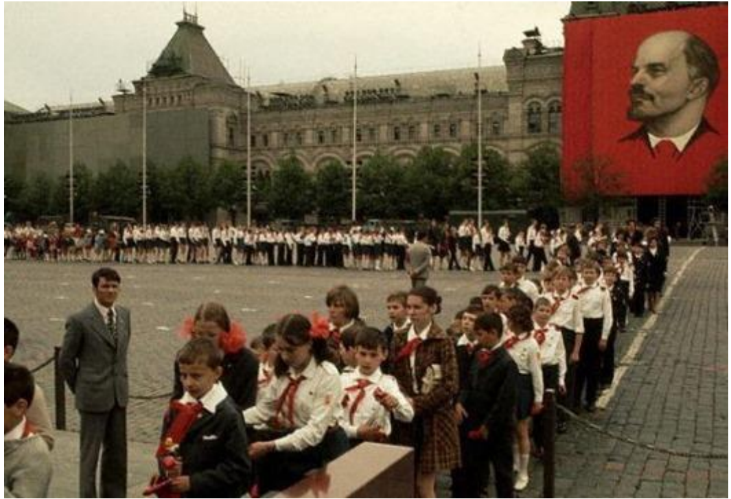
Рис. 7.3. День Пионера