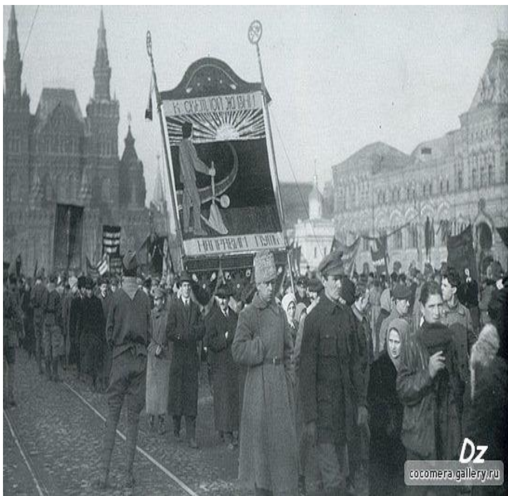
Рис. 6.3. Демонстрация на Красной площади в Москве 7 ноября 1918 года. Фотография ЦГАКФД, № 31685