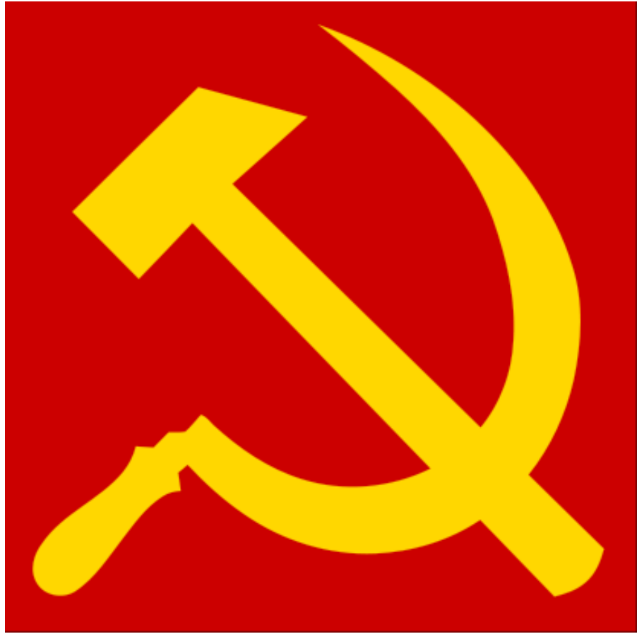
Рис.1.2. «Серп и молот» 25 апреля 1918 г. Е.И. Камзолкин