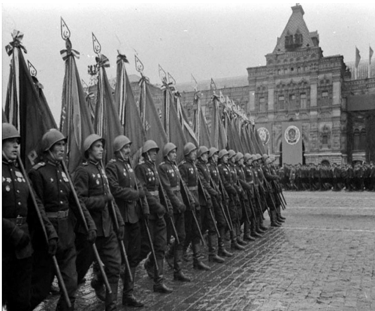
Рис. 9.3. Войска Красной Армии на Параде Победы, Москва. (Архивные фото)