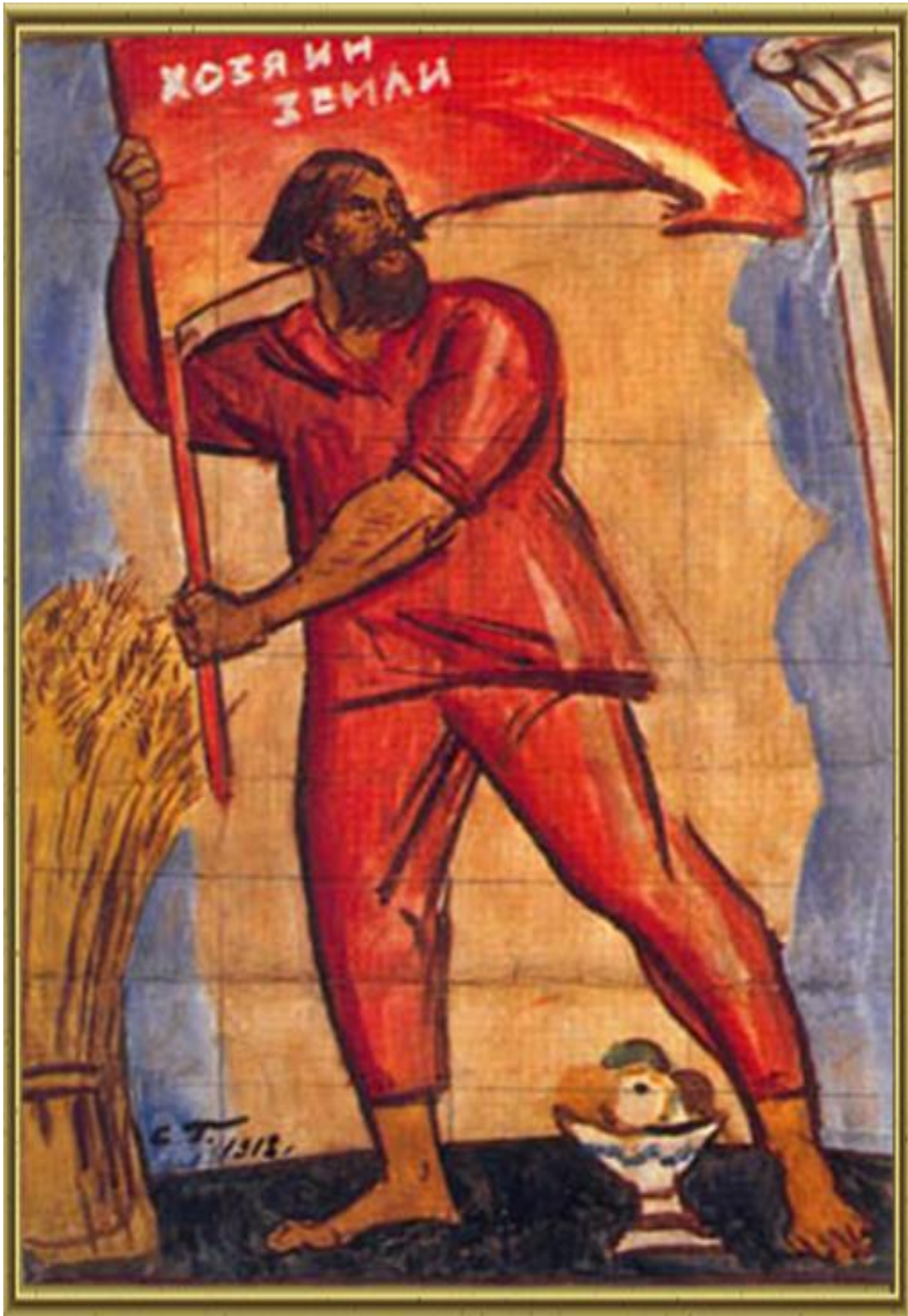
Рис.2.2. «Хозяин земли» С.Е. Герасимов 1918г.