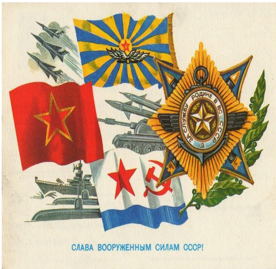
Рис. 8.3. Открытка День Советской Армии и Военно-Морского флота! Слава Вооруженным Силам СССР!