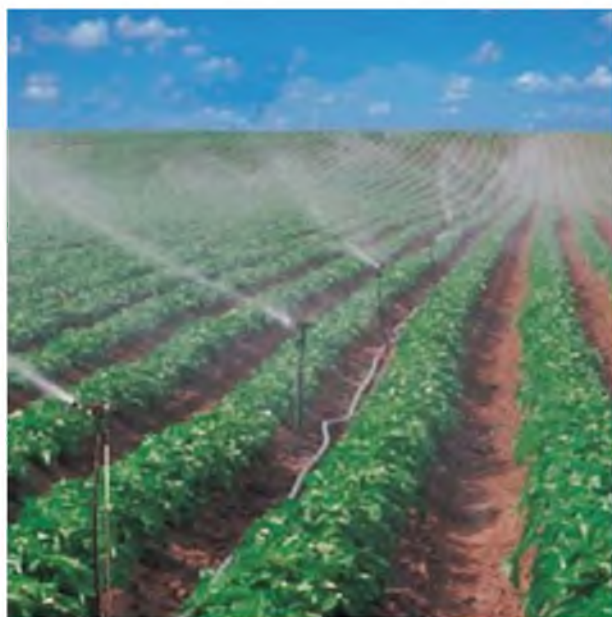
Рис 2. Работа спринклеров

Благодаря качественной работе оросительной системы, в совокупности с 1,5 га земельных угодий было получено 7,5 тонны картофеля, т.е. примерно 50 ц/га. Это объясняется тем, что основное назначение спринклерного орошения – создание природных условий влажности.