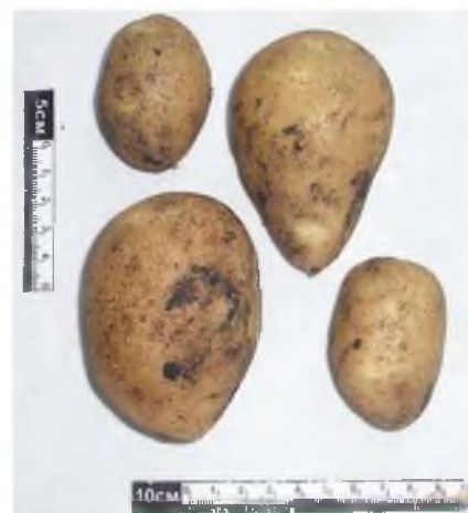
Рис. 4. Картофель с делянки после двух поливов

7. Л.Л. Убугунов «Величина и качество урожая картофеля в зависимости от орошения и удобрений» / Л.Л. Убугунов, М.Г. Меркушева, Б.Х. Будаев // «Экологическая оптимизация агропесоландшафтов бассейна оз. Байкал». Улан-Удэ. - 1990. - С. 113-126.