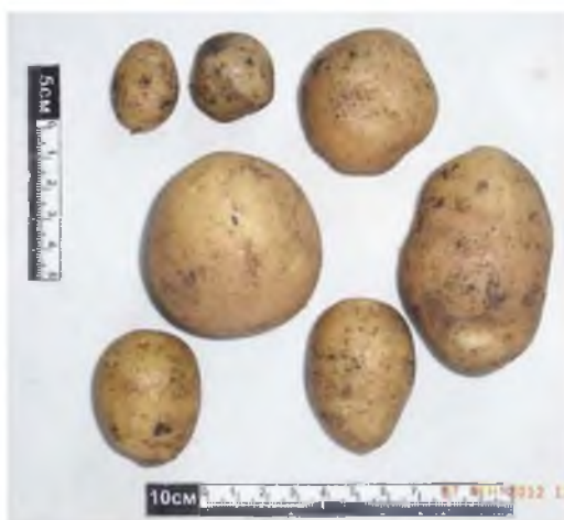
Рис. 3. Картофель без полива (контроль)