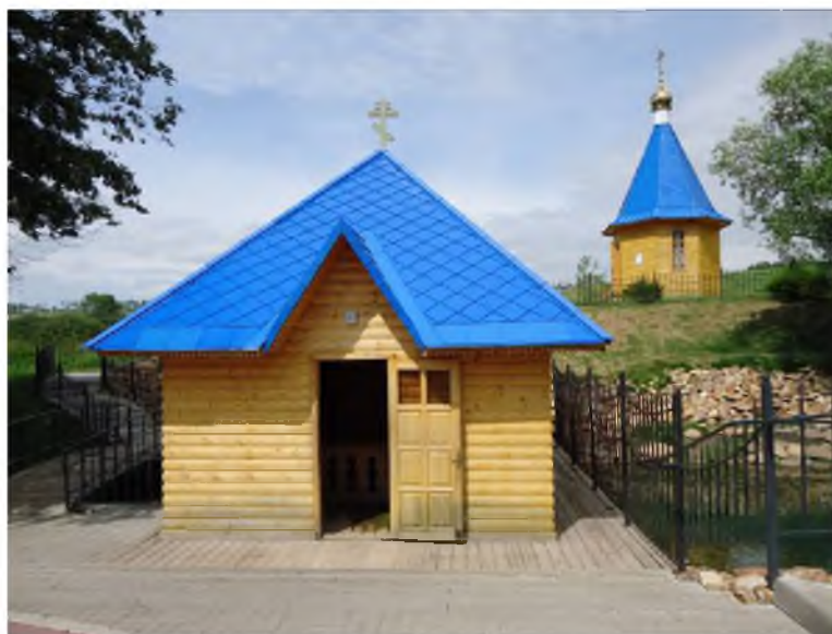
Рис. 3. Родник «Святой источник Архистратига Михаила» (№ 7, Прохоровский район)

Потребность в рекреационной оценке определяется тем, что оценка санитарно-технического состояния родников (СТСР) не отражает в полной мере привлекательности родника для проведения экскурсий. На рис. 3 показан родник «Святой источник Архистратига Михаила» (родник «Костромской», Прохоровский район, парк регионального значения «Ключи»).