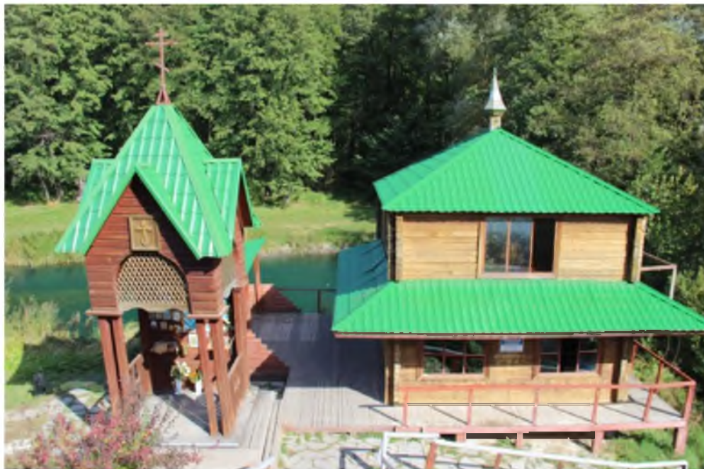
Рис. 1. Святой источник «Криница» (Яковлевский район, с. Шопино, №8)

Следует отметить, что родники с неудовлетворительной оценкой СТСП могут выглядеть не менее привлекательно, чем с хорошей. Например, Святой источник «Криница» (рис. 1) имеет неудовлетворительную оценку, которая обусловлена отсутствием каптажа и характеризует техническую оснащенность родника. Но этот источник используется в качестве купели для омовений, поэтому нет необходимости оборудовать его каптажем.