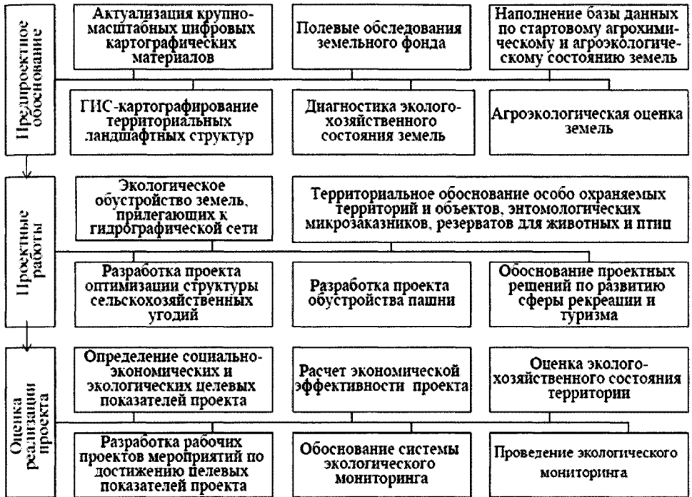
Рис. 2. Схема проведения работ при применении бассейновой концепции в природопользовании

Основой геопланирования на бассейновых принципах является реорганизация структуры угодий [3]. Организация структуры сельскохозяйственных угодий в увязке с рельефом и почвами (адаптивное землеустройство) и формирование экологического каркаса включали следующие этапы: 1) землеустройство пашни на основе бассейновых и позиционно-динамических принципов; 2) проекты лесонасаждений; 3) проекты водоохраных зон; 4) рационализация использования кормовых угодий; 5) проекты рекреационных зон; 6) выявление новых природных резерватов.