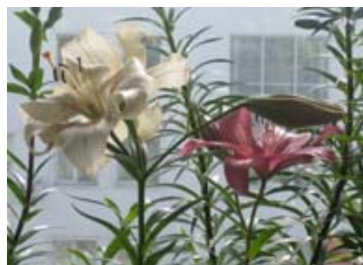
Рис. 1. Выгонка лилий в учебной аудитории БелГУ

Лилии из групп Азиатские и ЛА-гибриды весьма разнообразны