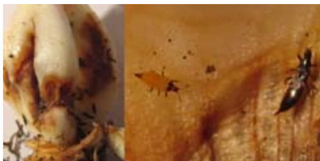
Рис. 4. Повреждение луковицы лилии трипсами