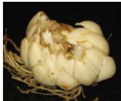
Рис. 3. Луковица лилии с двумя почками

Перед выгонкой луковицы должны пройти период покоя при низких положительных температурах (ниже 5°C) в течение 6 недель (в холодном погребе, холодильнике). Частично они набирают такие температуры в сентябре-