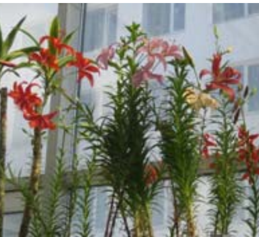
Рис. 2. Выгонка лилий в зимнем саду БелГУ

кими лежащими стеблями отличались различные по высоте сорта 'Вера', 'Доброе утро', 'Калинка', 'Сиреневая кудрявая'. Замечательно смотрелись в контейнерах прочные цветущие побеги высокорослых сортов 'Анастасия', 'Оксана', 'Эмблема'.