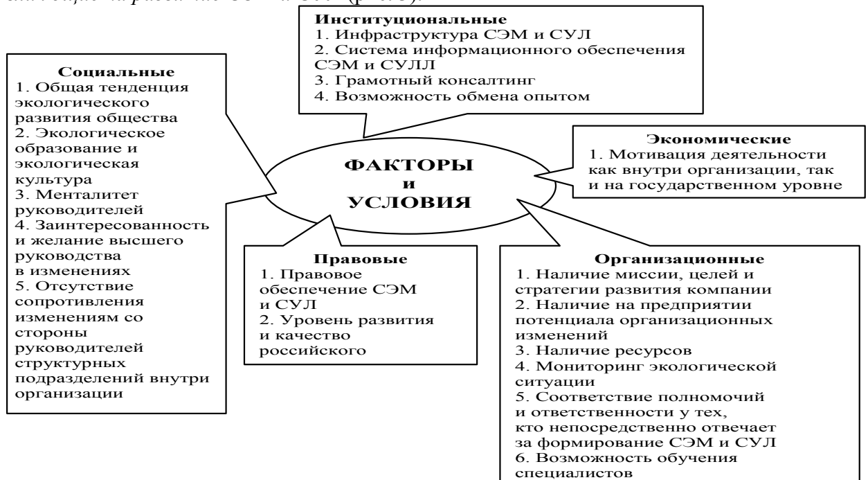
Рис. 3. Факторы и условия, влияющие на развитие СЭМ и СУЛ на предприятиях ЛПК

На основе анализа выявленных факторов, влияющих на экорейтинг компаний лесной отрасли, проблем и трудностей, связанных с экологизацией производства, а также критериев устойчивого развития предприятий ЛПК были определены факторы и условия, влияющие на развитие СЭМ и СУЛ (рис. 3).