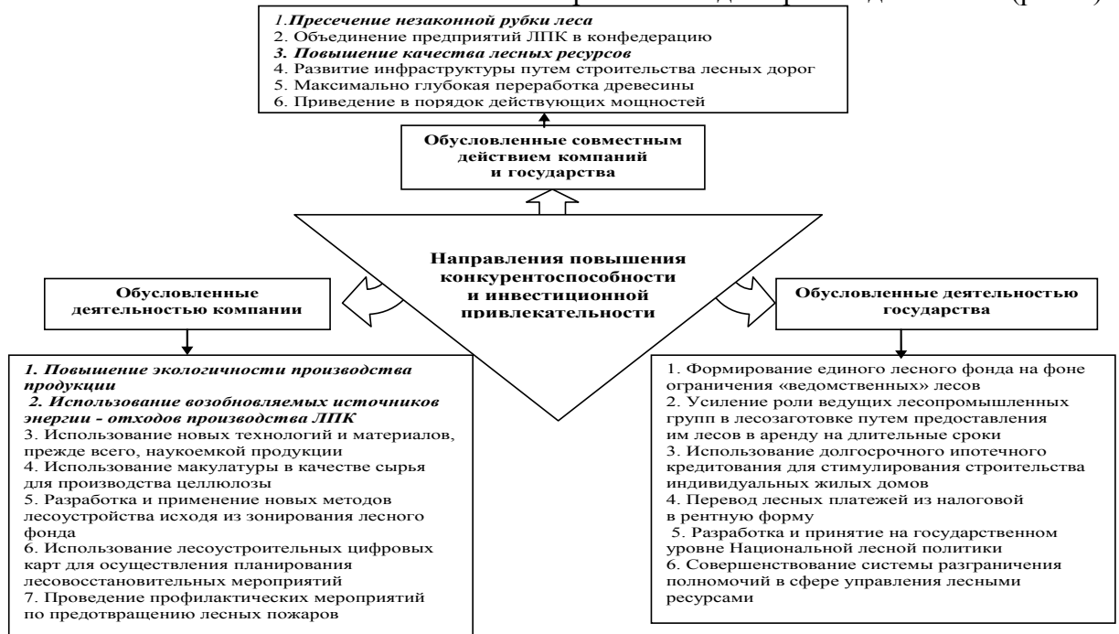
Рис. 2. Направления повышения конкурентоспособности продукции и инвестиционной привлекательности ЛПК

леса, повышение качества лесных ресурсов и экологичности производства продукции, использование возобновляемых источников энергии – отходов производства ЛПК (рис. 2).