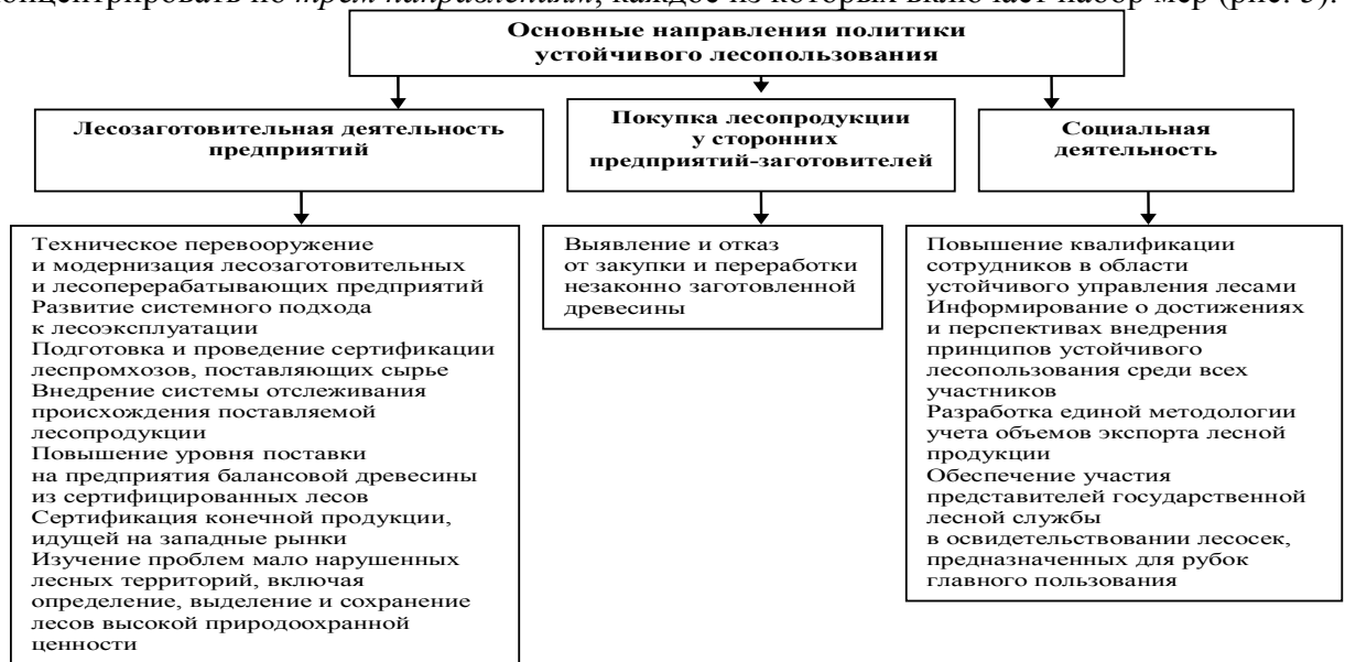
Рис. 5. Направления политики устойчивого лесопользования

Политику предприятий в области устойчивого лесопользования необходимо сконцентрировать по трем направлениям , каждое из которых включает набор мер (рис. 5).