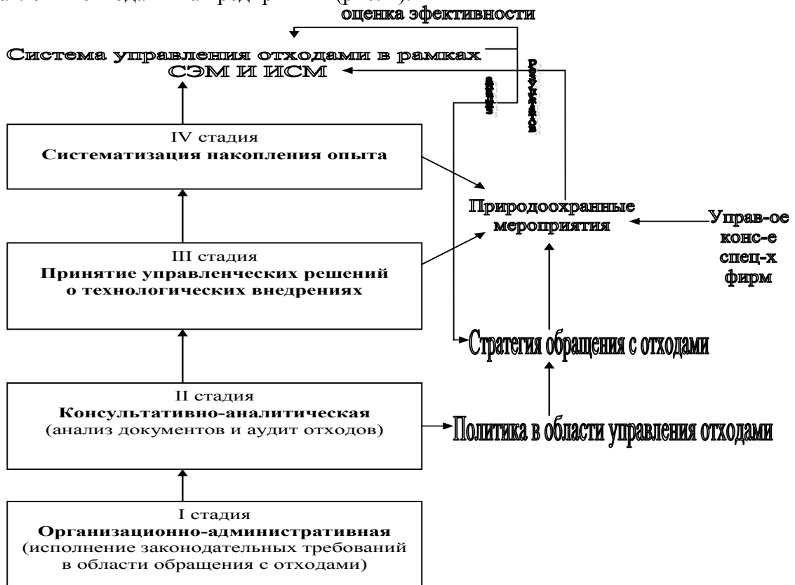
Рис. 4. Алгоритм формирования и функционирования системы управления отходами на предприятии

На основе учета последовательности процессов, определяющих порядок действий в сфере управления отходами, а также результатов анализа производственных процессов в компаниях ЛПК, был разработан алгоритм формирования и функционирования системы управления отходами на предприятии (рис. 4).