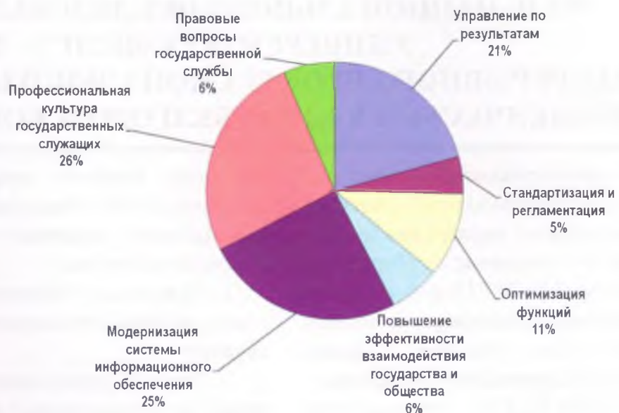
Рис. 1. Структура программ подготовки государственных гражданских служащих