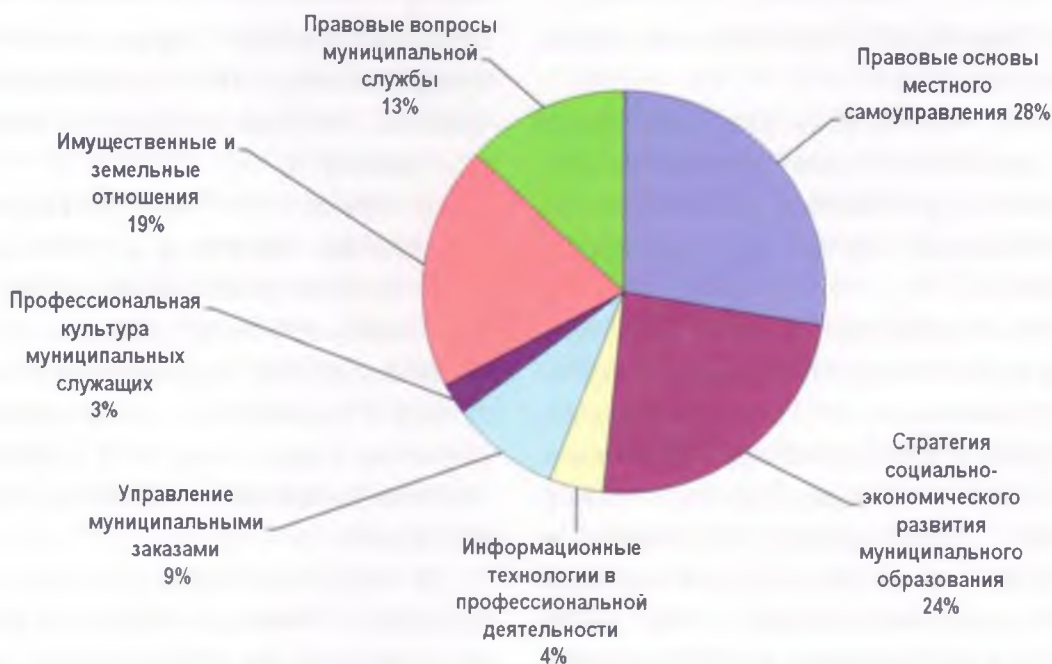
Рис. 2. Структура программ подготовки муниципальных служащих

Особенностью подготовки муниципальных служащих является модульный подход, предусматривающий изучение отдельных модулей с использованием системы электронного обучения и организация выездных семинаров на базе Заказчика в соответствии с соглашениями о сотрудничестве, заключенными между администрацией губернатора, БелГУ и муниципальными образованиями.